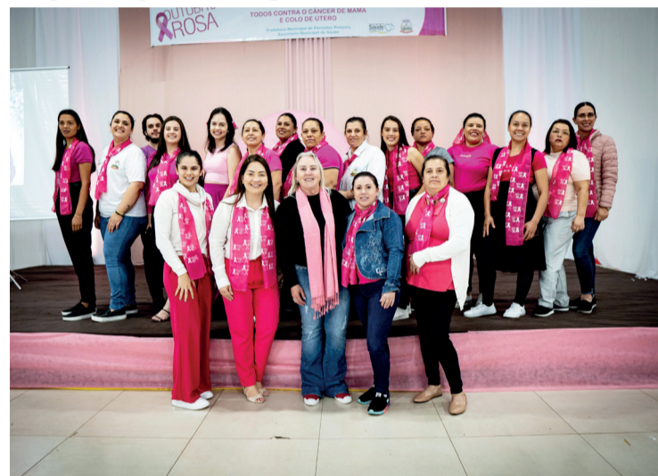
Equipes da Secretaria de Saúde e demais áreas participaram do evento

Para que mulheres de todas as regiões do município pudessem participar, foi disponibilizado transporte, além de um delicioso café após o encerramento.