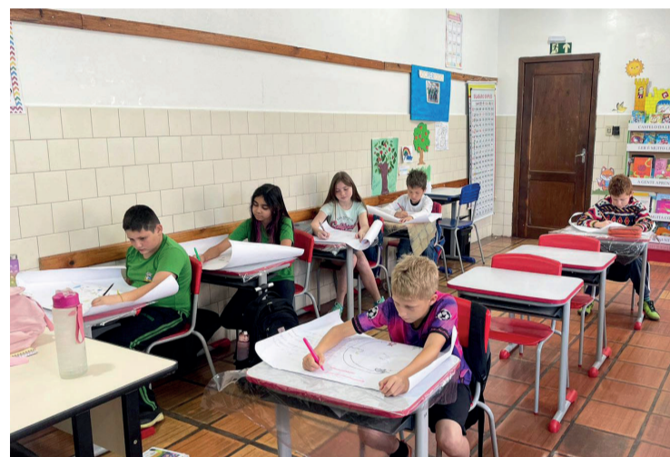
Os cartazes ilustram o funcionamento da cadeia alimentar

Projeto reforçou o entendimento sobre a cadeia alimentar e a importância da preservação ambiental