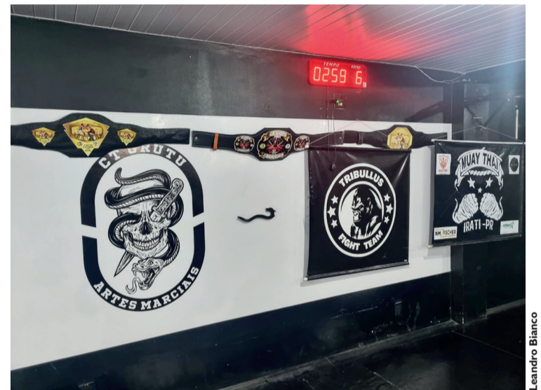
As equipes Checkmat e Tribullus Fight Team treinam no CT