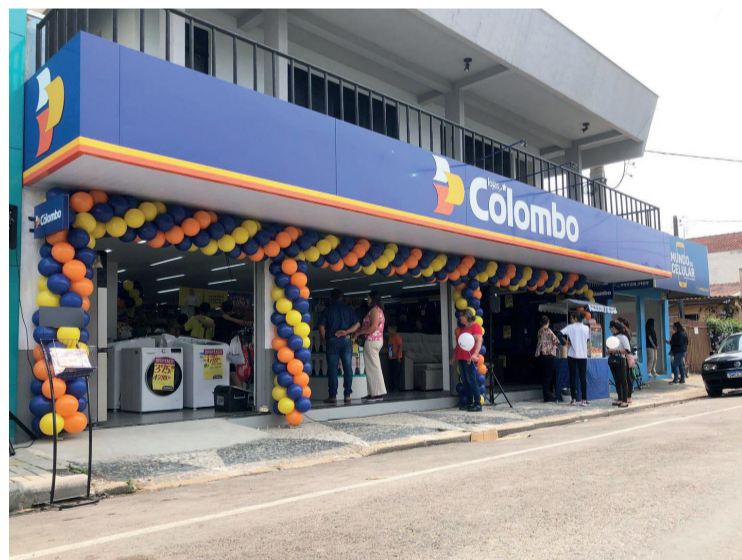
Loja está localizada na Avenida Manoel Ribas, 836, no centro da cidade

A loja oferece produtos de marcas reconhecidas como Brastemp, Consul, Electrolux, Ortobom, Cadence, Motorola e Marketplace