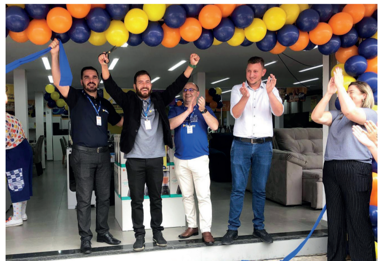
Nova loja se destaca na simplicidade e atendimento de qualidade