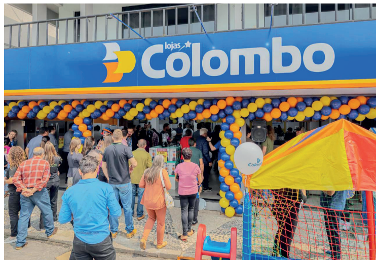
Inauguração trouxe à população condições exclusivas de pagamento

de 10 mil habitantes, esse é o nosso planejamento, e Rio Azul fazia parte desse processo. Nós estamos muito felizes com o carinho que a gente encontrou aqui, essa cidade tem simplicidade, gente trabalhadora, por isso