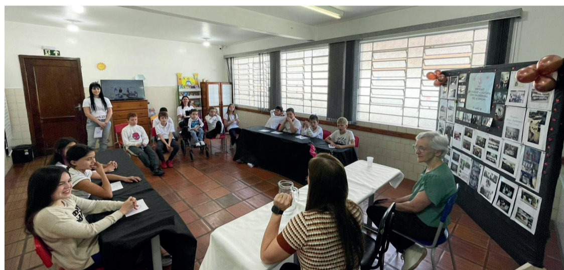
As entrevistadas também falaram sobre como a tecnologia mudou ao longo dos anos

Durante o bate-papo, as professoras compartilharam suas memórias e experiências