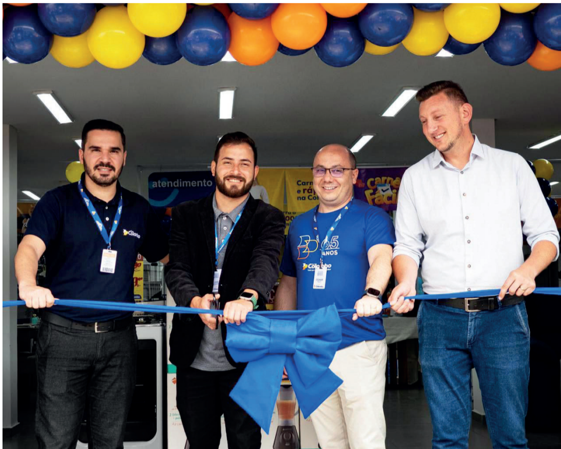
Lojas Colombo trabalha para proporcionar a melhor experiência aos clientes e promoções incríveis

A inauguração trouxe à população de Rio Azul condições exclusivas de pagamento, como o parcelamento em até 12 vezes sem juros através do Carnê Fácil, além de diversas outras opções financeiras que incluem consórcios e empréstimos pessoais. A loja oferece ainda uma seleção completa de produtos que abrangem desde eletrodomésticos de grandes marcas, como Brastemp, Electrolux e Consul, até artigos esportivos e de