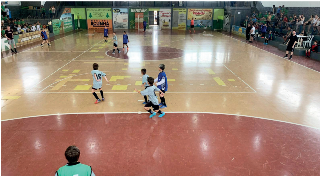
Seis escolas municipais participaram das competições com modalidades individuais e coletivas

Confira a classificação completa no site da Folha de Irati: https://www.folhadeirati.com.br/