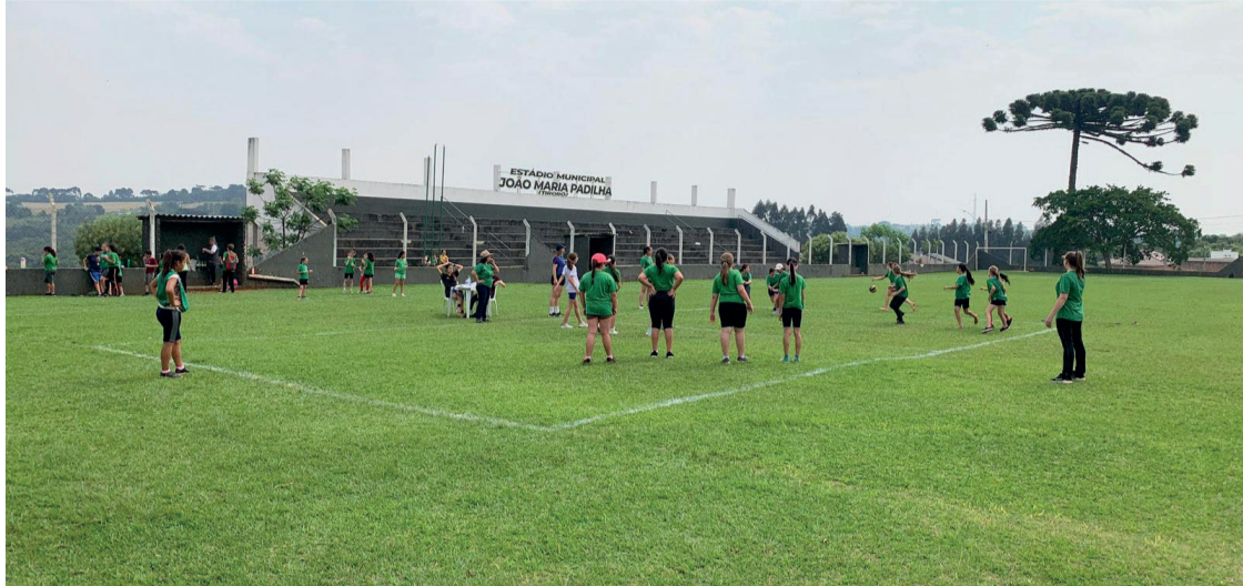
Abertura contou com a participação das delegações das escolas participantes com os desfiles dos atletas

Evento tem como objetivo incentivar as práticas esportivas