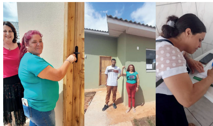
Prefeitura de Imbituva

“Convido a todos para prestigiar este momento mágico aqui em Guamiranga. Teremos atrações bem bacanas para as crianças aproveitarem com a família. Além disso, estará presente também a Feira da Lua, muito importante para fomentar a venda dos nossos produtores rurais. Participe!” finaliza Leite.