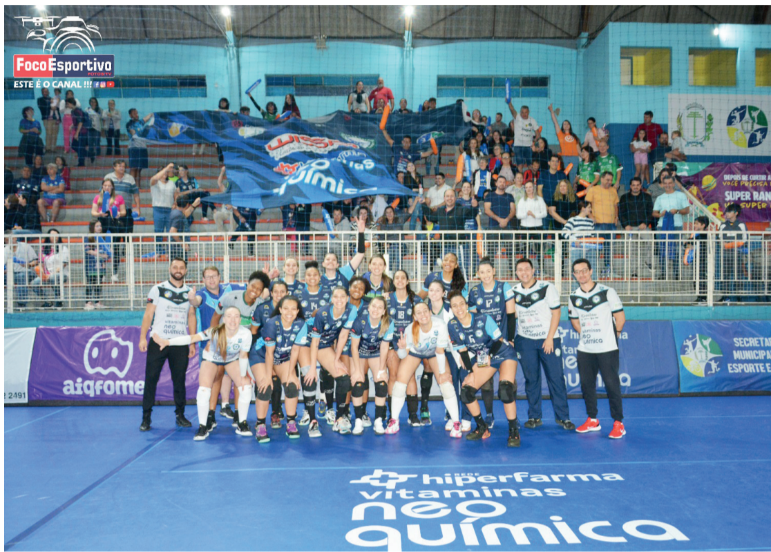
Na foto, o momento em que a equipe de Irati se sagrou campeão da competição da Super Liga C

A equipe de Irati enfrentou diversas equipes e conseguiu um bom desempenho avançando até a grande final.