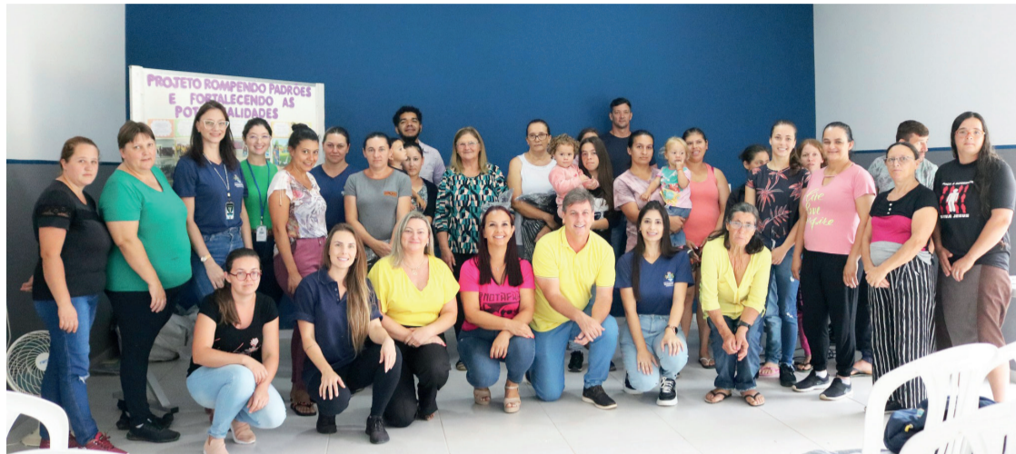
Prefeitura de Prudentópolis

Objetivo é criar espaço de acolhimento e troca de conhecimento