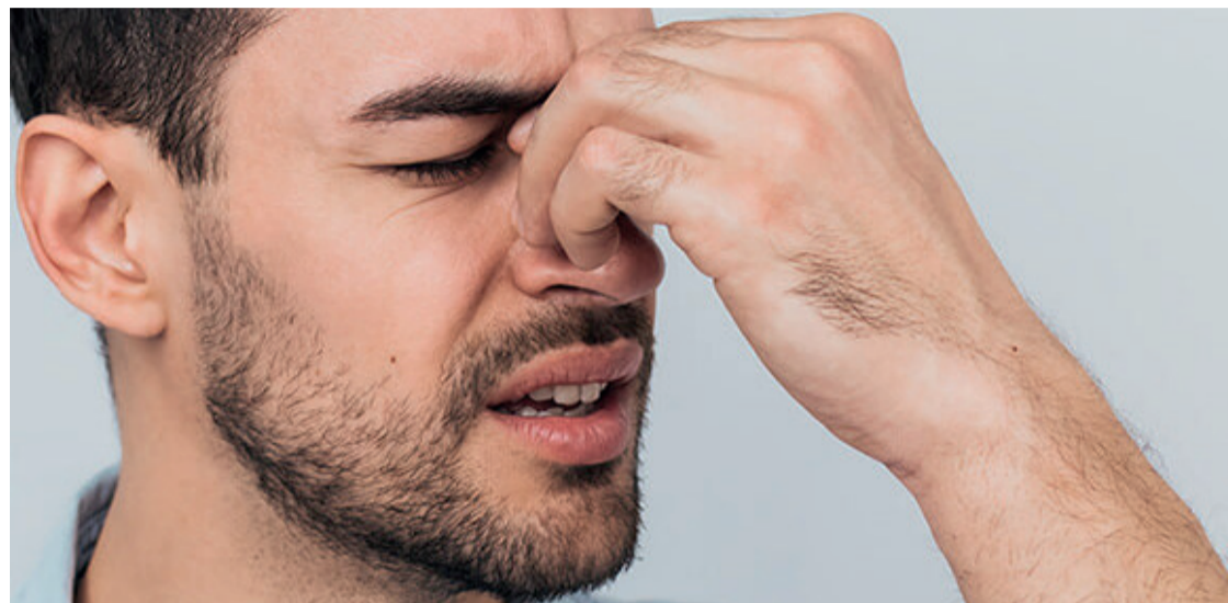
Se o paciente ainda estiver em fase de crescimento, a tendência é o desvio se acentuar com o tempo

Lesões traumáticas geralmente causam danos assimétricos à cartilagem, resultando no domínio de um lado sobre o outro. Se o paciente ainda estiver em fase de cres-