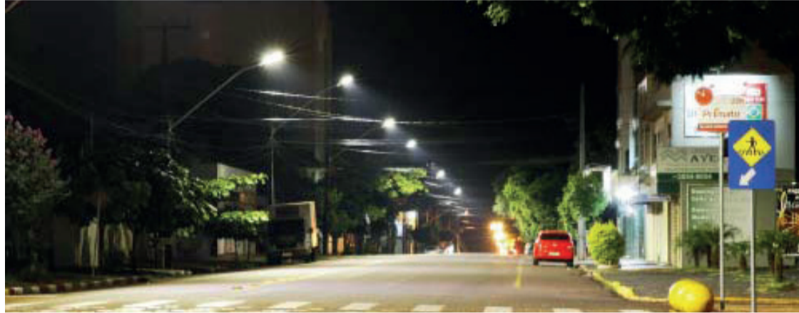
O projeto prevê a troca de lâmpadas de vapor de sódio por LED, além de outras vantagens

Através do Conder, sete municípios da região participam de consórcio; Câmara de Vereadores votam projeto