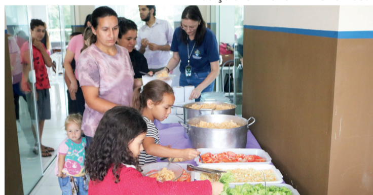
Prefeitura de Prudentópolis