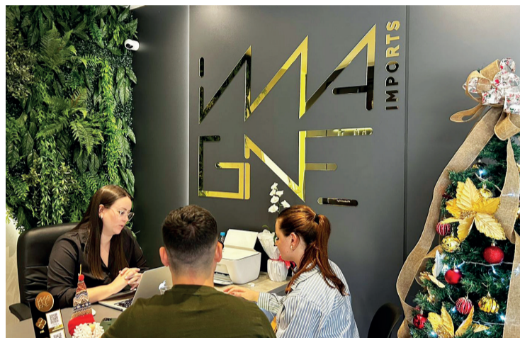
A Imagine Imports é especializada em produtos Apple

O prazo de entrega varia entre 15 a 20 dias, mas segundo Lia, o pro-