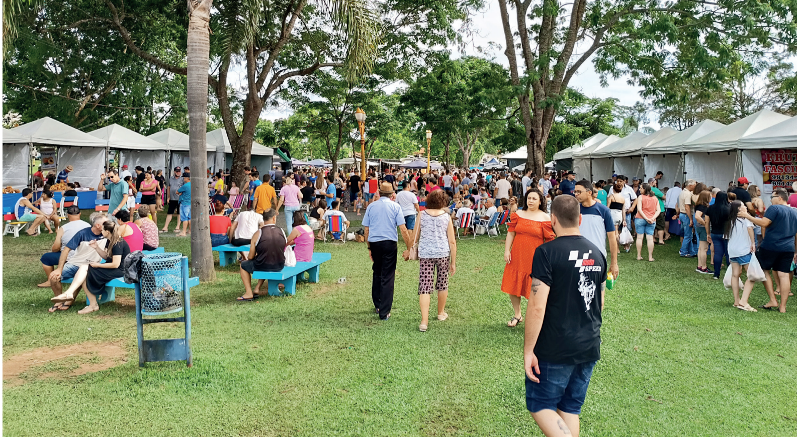
Evento ofereceu uma ampla variedade de opções de imóveis, desde residências para famílias até oportunidades de investimento comercial