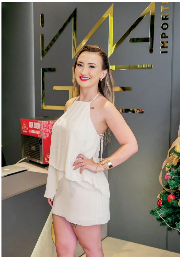
“Nosso objetivo sempre foi tornar a experiência do cliente inesquecível!”

Loja é especializada em produtos Apple e busca proporcionar uma experiência única aos clientes