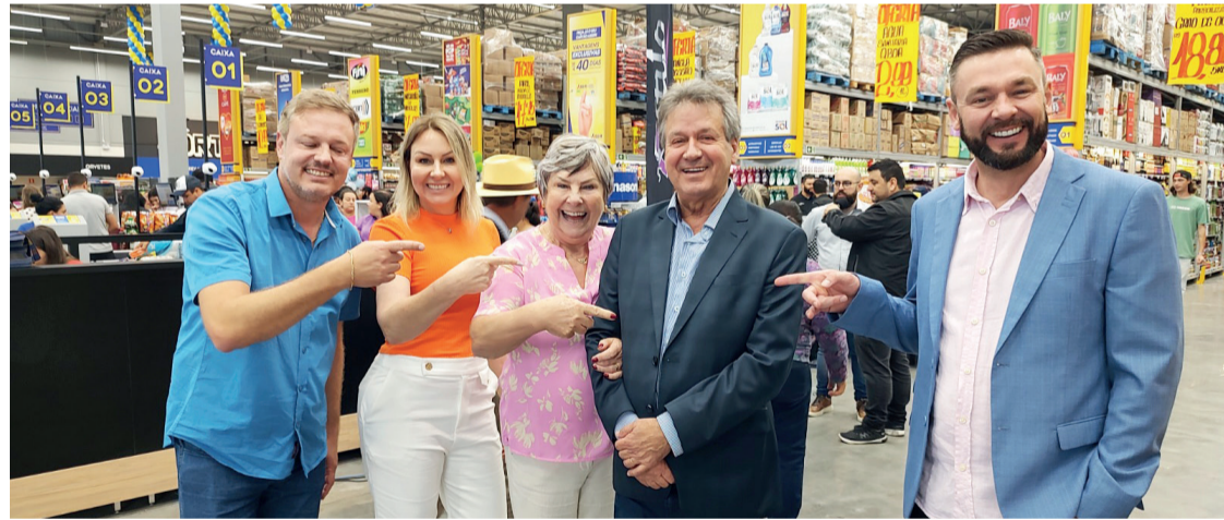
A família Bobato junto com Assir, que dá o nome ao novo atacado, durante a inauguração do empreendimento

O Assir Atacadista funcionará das 8h da manhã, às 20h da noite.