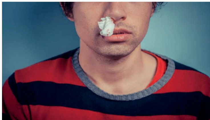
Mais de 60% da população já teve ou terá sangramento nasal

CRM 18299 RQE 13511 Médico formado pela UFPR Residência médica ORL - H.A.C Membro titular ABORL Mestrado clínica cirúrgica IPEM (H.U.E/UFPR)