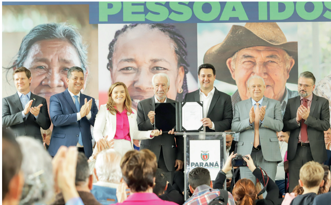
Lei garante reserva de passagens intermunicipais gratuitas/desconto para pessoas com 65 anos ou mais

“A ideia é fortalecer cada vez mais esse aten-