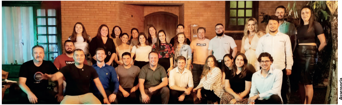
O encontro contou com muito networking e agregou ao conhecimento de todos os participantes