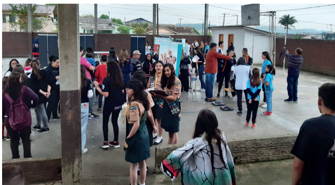
Além de exposições, o evento contou com diversas atividades envolvendo a saúde

O Projeto Folha na Escola parabeniza a todos os envolvi-