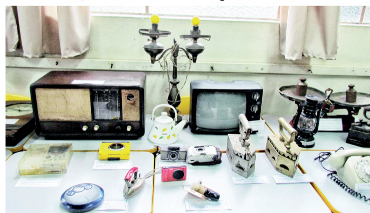
Houve exposição de objetos antigos, parte das atividades do Pré-Escolar

Mas as atividades da Escola Municipal Padre Wen-