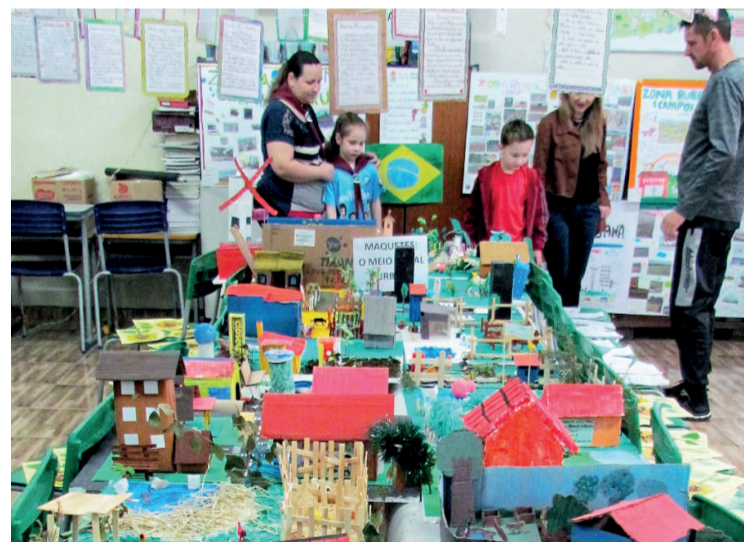
Os alunos puderam expor os trabalhos escolares para toda a comunidade

Uma escola de qualidade deve valorizar e incentivar a participação e o envolvimento de todos. Somos todos nós que fazemos a escola dos nossos sonhos, uma Educação melhor, acessível e democrática e, com isso, uma sociedade melhor e mais próspera, pois só a Educação faz pessoas melhores.