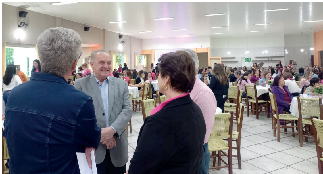
Diversas autoridades estiveram presentes no evento e falaram sobre a importância da prevenção