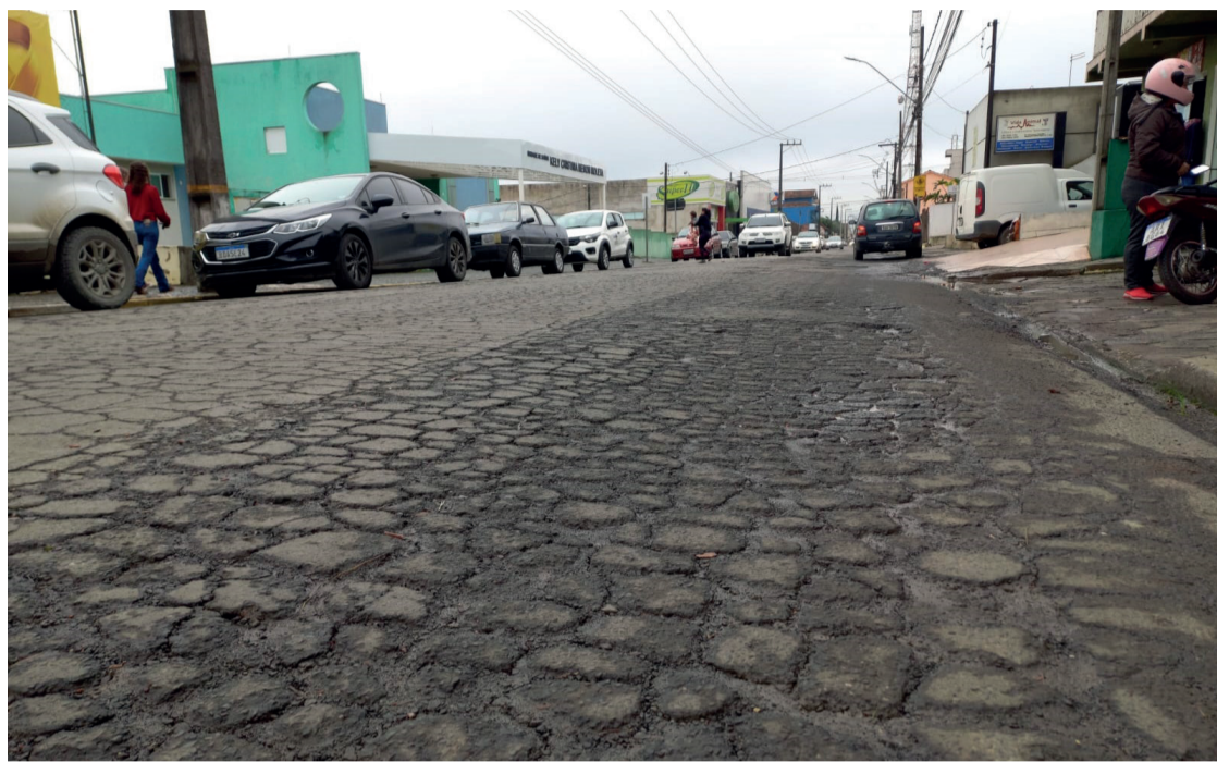
BR-153 possui trajeto que passa pelo Centro. Rodovia Federal que é responsabilidade do município

A BR-153 possui um trecho que passa pelo Centro de Imbituva. Neste trecho, embora seja uma Rodovia Federal, é responsabilidade do município a manutenção da via. Para recuperar o desgaste do