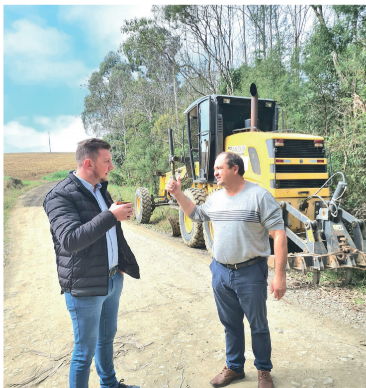
As melhorias se estenderam por várias comunidades do município

As melhorias se estenderam por várias comunidades, incluindo Água Quente dos Meiras, Faxinal do São Pedro, Porto Soares, Vila Nova, Cerro Azul, Rio