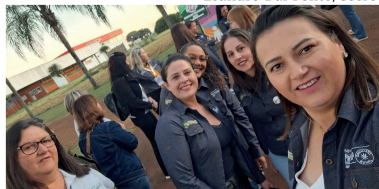
Cidade de Cascavel foi escolhida por ser uma importante região agrícola