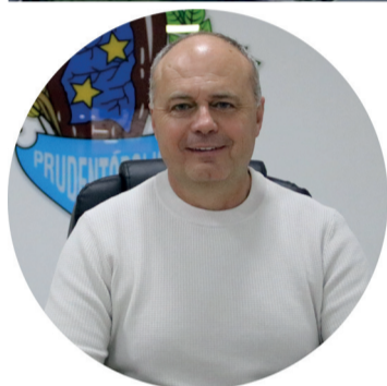
LETÍCIA H. PABIS COM REPORTAGEM DE KAUANA NEITZEL

Município comemora emancipação política no dia 12 de agosto