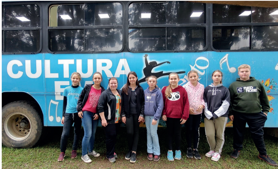
Crianças da localidade de Barra Bonita participam dos cursos ofertados pelo "Cultura em Movimento"

São dois ônibus, um que atende as comunidades do interior e outro que passa pelos bairros do Centro. No interior, seis comunidades já foram atendidas, assim como na cidade, atualmente, os ônibus estão no Rio de Areia e Barra Bonita. As oficinas oferecidas são: violão, informática,