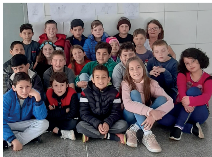
Os alunos participaram de uma importante discussão sobre respeito

no. Depois dão um nome ao mesmo. Todos em círculo apresentam o desenho aos colegas. Perceberam que apesar de terem recebido os mesmos comandos, cada