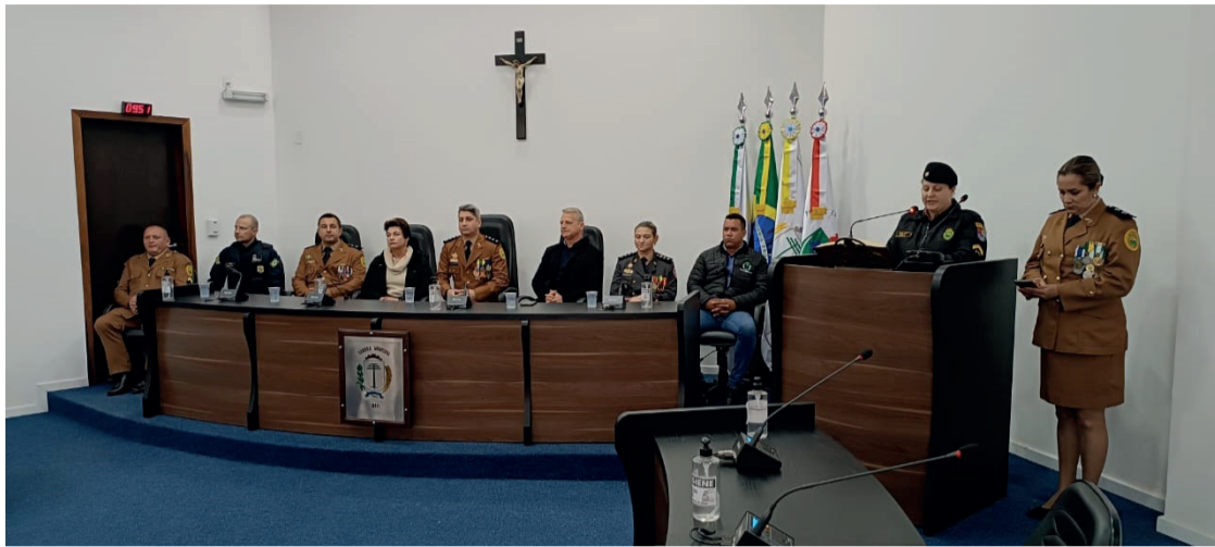
A solenidade contou com a presença de diversas autoridades municipais e também da região

Na manhã de quinta-feira (10), aconteceu na Câmara de Vereadores de Irati, a solenidade em comemoração aos 169 anos da Polícia Militar do Paraná, organizada pela 8ª CIPM. Na ocasião, estiveram presentes o Comandante da 8ª Companhia Independente,