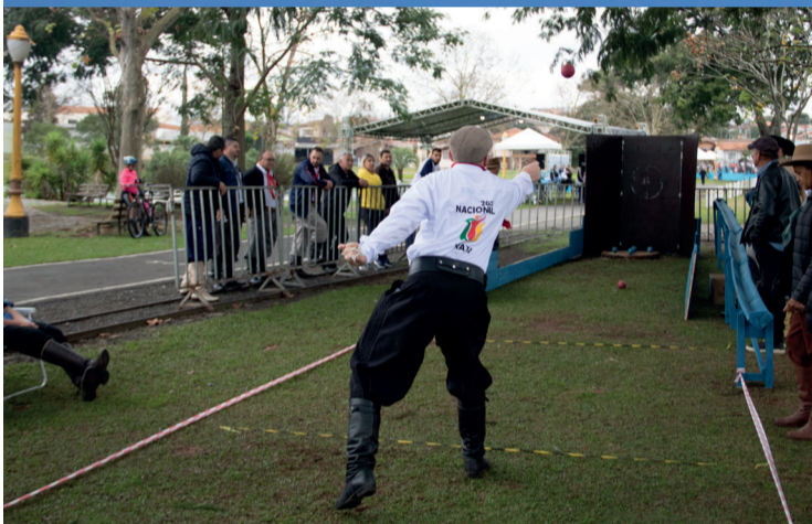
Folha de Irati