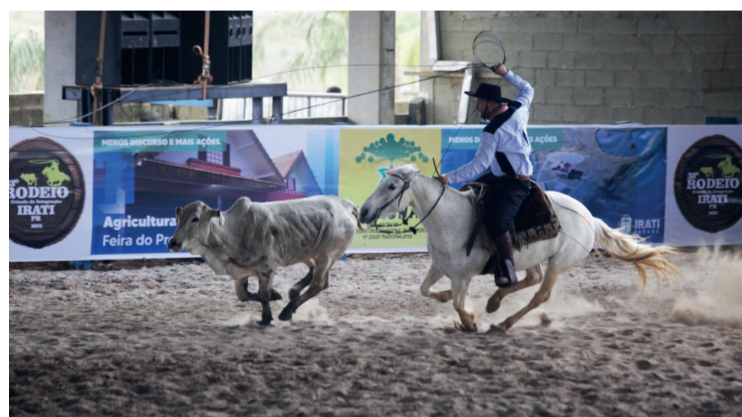
Evento atraiu competidores de diversas partes do país

contou com a presença de um grande público apaixonado pelo universo do rodeio e das habilidades campeiras.