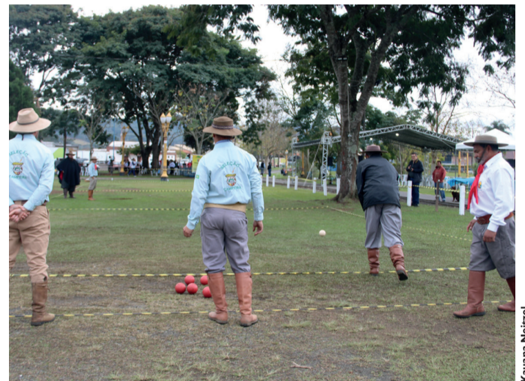
O time masculino de Bolão de Prudentópolis é o campeão nacional