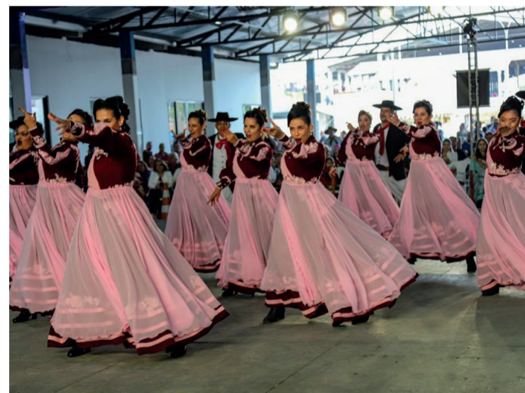
Após seis anos, FENART volta aos palcos e encanta o público