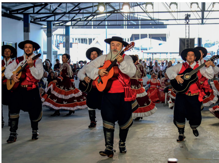
Ao todo, cerca de 9 mil competidores participaram do Nacional 23