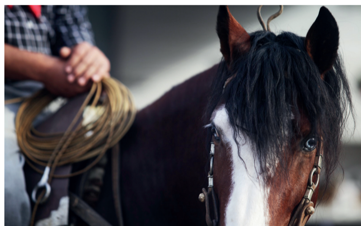
20º Rodeio Crioulo Nacional de Campeões foi um sucesso