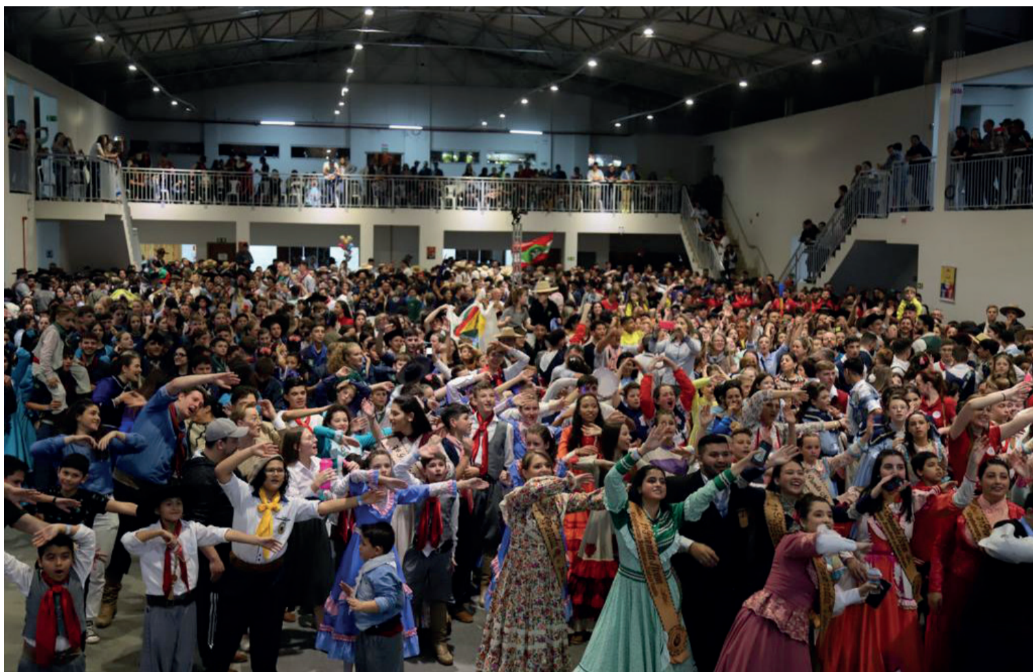
Evento movimentou em torno de 10 mil pessoas, vindas de outros estados e cidades do Paraná para definir campeões nacionais

De acordo com o presidente da Confederação Brasileira da Tradição Gaúcha (CBTG), Roberto Basso, a edição do Nacional realizada em Irati foi uma das maiores já registradas, principalmente pelo número de participantes inscritos em competições - aproximadamente cinco mil. “Muitos não conheciam Irati e passaram