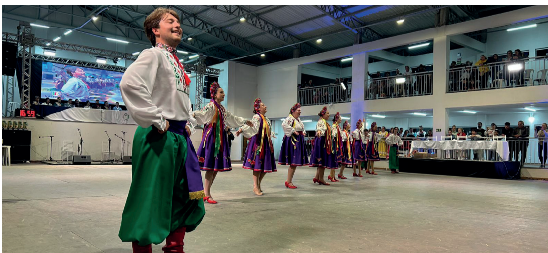
Esta é a primeira vez que o grupo vem ao Brasil e, também, tem contato com a cultura gaúcha