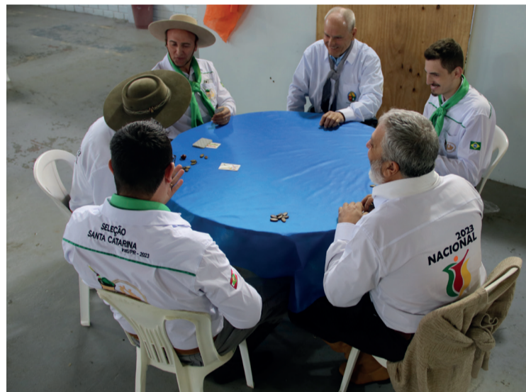
O 10º Jogos tradicionalistas marcaram o Nacional 2023

nos Jogos se tornou campeão nacional. O objetivo dos jogos é preservar e divulgar os hábitos, os costumes, as tradições e o folclore rio-grandense.