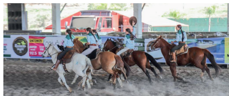
Equipe campeã que representou o Paraná na prova Prenda Juvenil