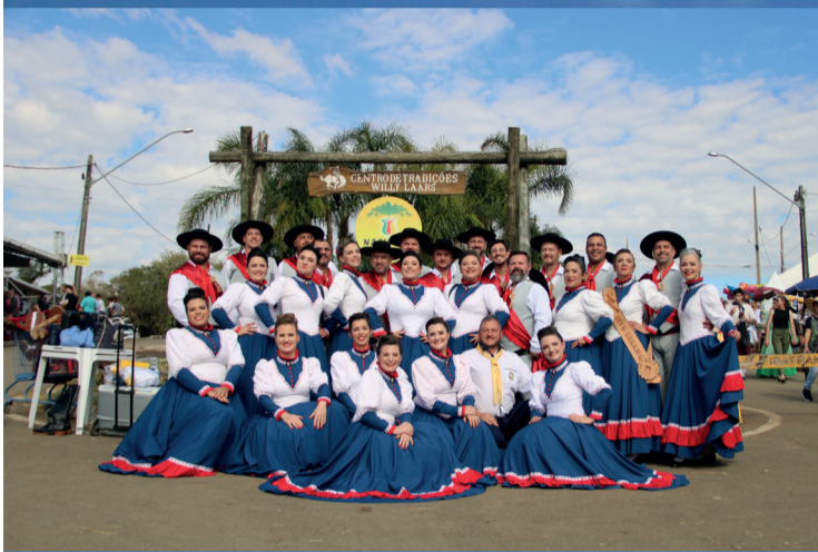
Folha de Irati