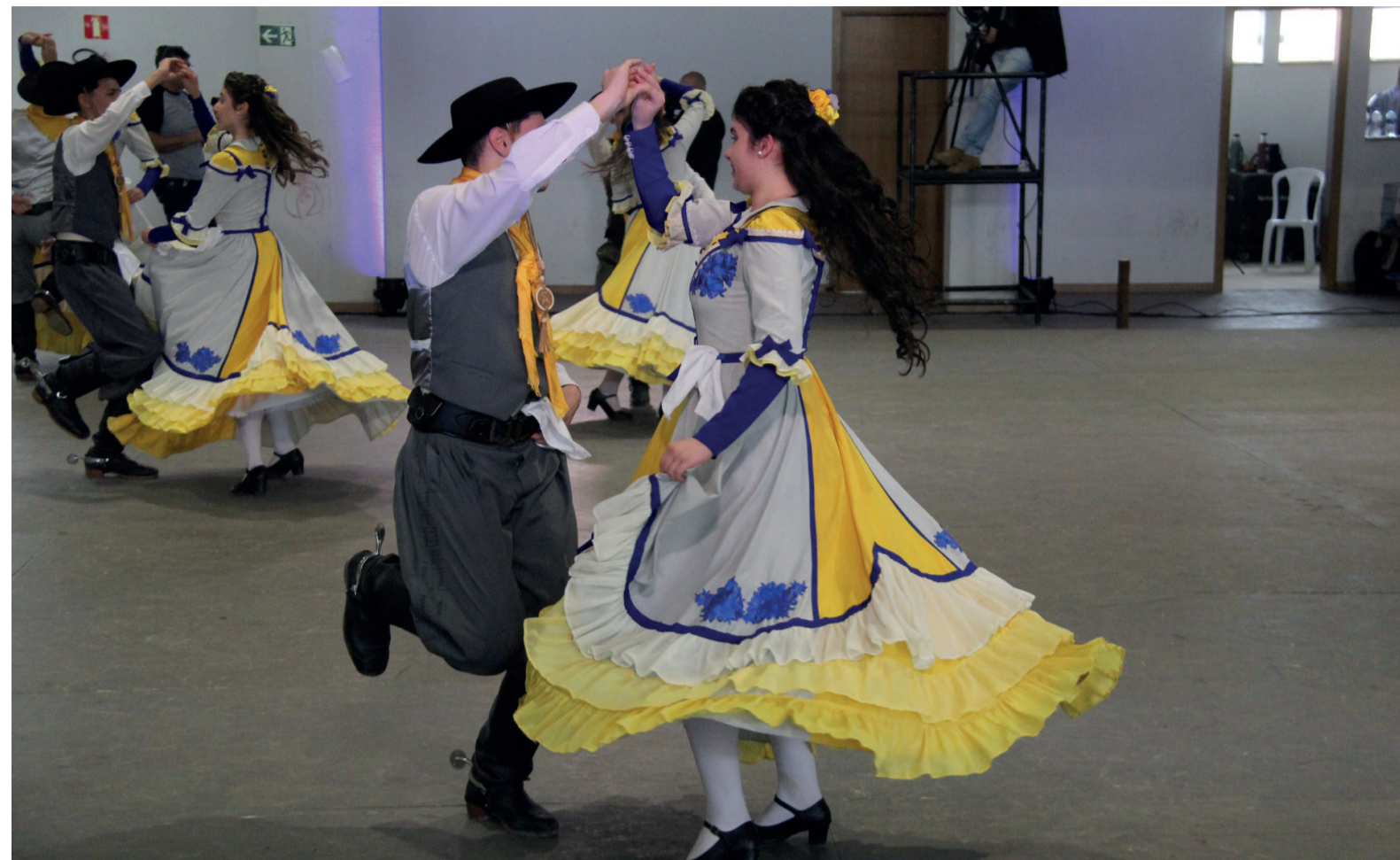
O Nacional proporcionou a cidade de Irati uma oportunidade única, que é prestigiar um evento brasileiro que une pessoas de todo o país

A equipe da Folha de Irati conversou com alguns participantes, técnicos responsáveis, organizadores e diretores de alguns Movimentos Tradicionalistas Gaúchos (MTG) de diferentes estados para saber como foi para eles participar das competições do 15º FENART.