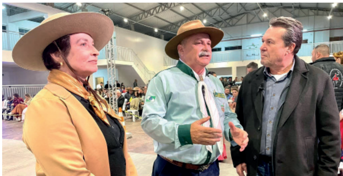
O Governo do Estado vai investir mais R$ 600 mil no CT Willy Laars, em barracões para exposições

como as que ocorrem na ExpoIrati. O secretário estadual afirmou ter ficado surpreendido com a estrutura em Irati, que abriga neste final de semana um evento com participantes de vários estados brasileiros. "O Governo do Estado