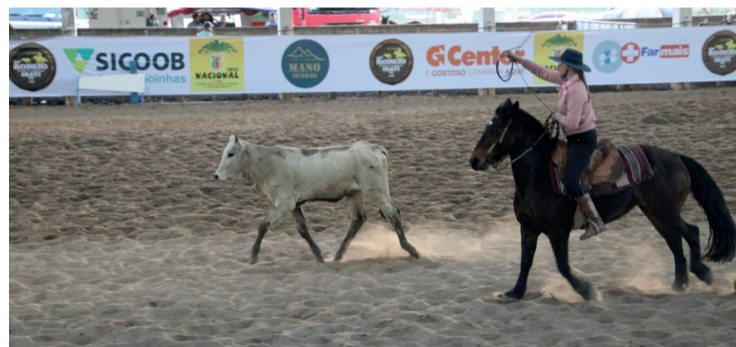
Público acompanhou as provas de laço, chasque, rédea e vaca parada