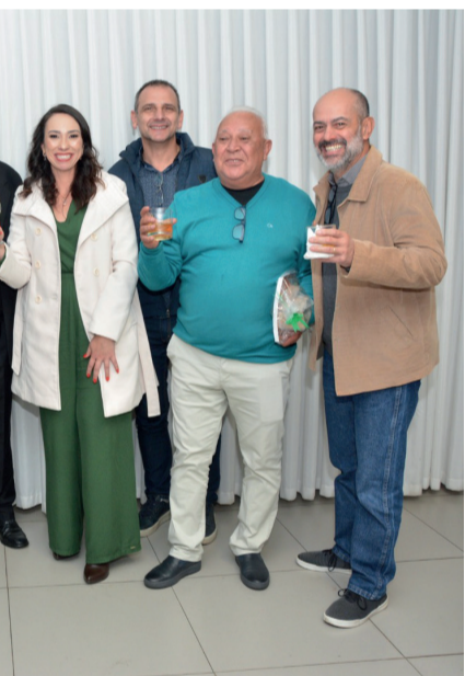
Dallegrave contou com diversas pessoas

O livro está à venda no Sebo Centenário (na Rua