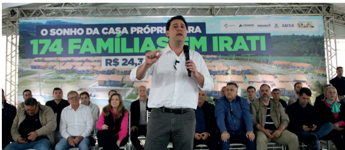
“Temos o maior programa de casa própria do Brasil”, destacou o governador Ratinho Jr.

O prefeito de Irati, Jorge Derbli, destaca a importância da construção de casas no município, pois existe um