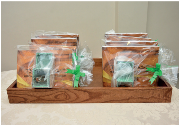
Dinheiro arrecadado com o livro será destinado a APAE de Irati