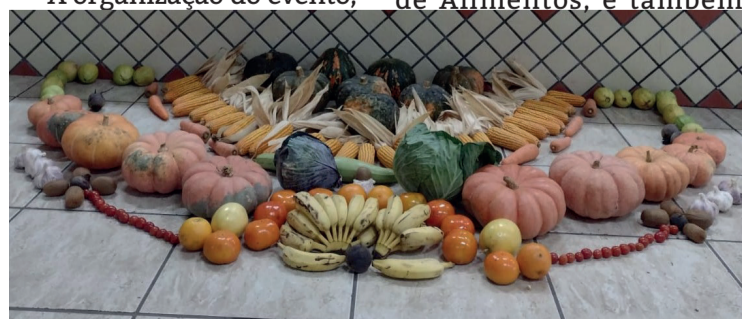
Conferência abordou também a importância de uma alimentação saudável