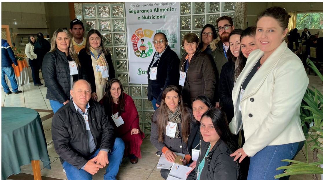
Conferência aconteceu na Associação dos Servidores Públicos Municipais de Irati

que aconteceu na Associação dos Servidores Públicos Municipais de Irati, das 8h30 às 16h, foi realizada pelo Centro de Processamentos de Alimentos, e também