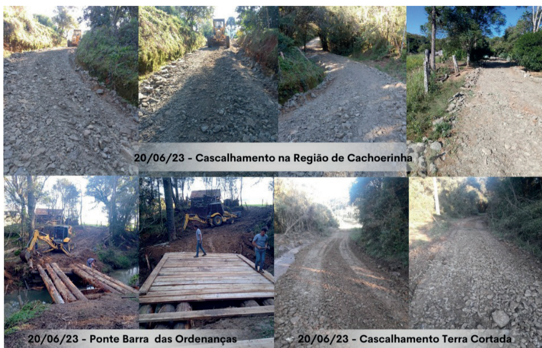
20/06/23 - Cascalhamento na Região de Cachoerinha

Vale destacar que no mês de abril a Gestão Municipal, através da Secretaria de Transporte e Infraestrutura, realizou benfeitorias em diversos pontos da zona rural do município, chegando a um total de 46 comunidades e, aproximadamente, 134 pontos, em