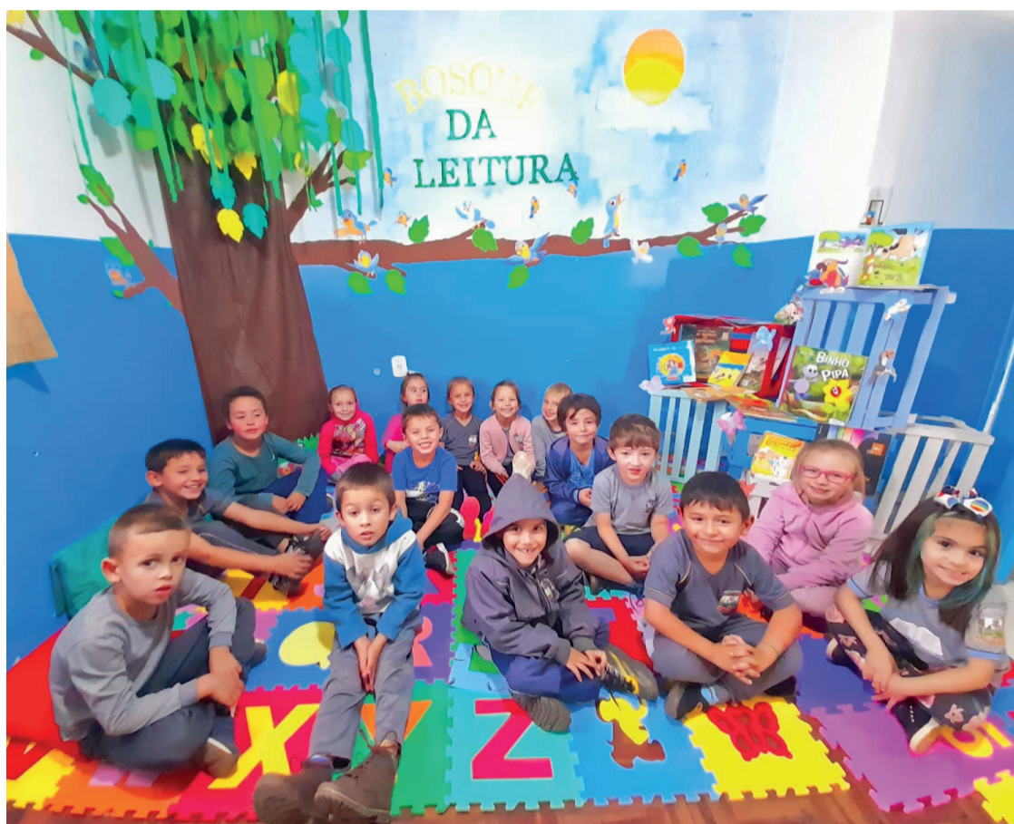
Os alunos de Fernandes Pinheiro, realizaram uma atividade envolvendo leitura e escrita

A leitura e a escrita são habilidades fundamentais que desempenham um papel essencial no desenvolvimento humano e na construção de uma sociedade informada. Através da leitura, somos expostos a uma infinidade de conhecimentos, ideias e perspectivas, expandindo nossos horizontes e enriquecendo nosso intelecto. Além disso, a leitura desenvolve nossa capacidade de compreensão, análise crítica e empatia, nos tornando cidadãos mais conscientes e tolerantes.