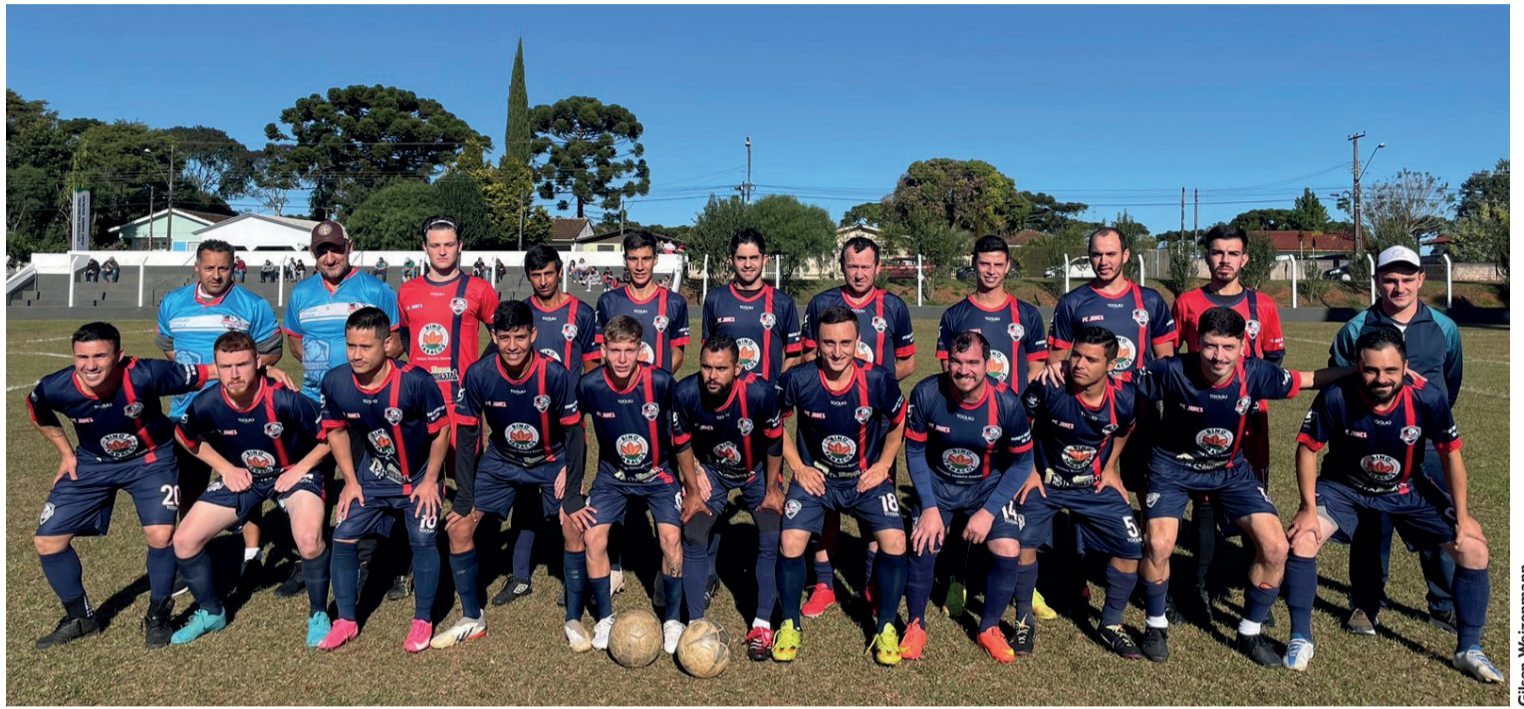
A segunda rodada da semifinal aconteceu no dia 18 de junho. A equipe do Passatempo conseguiu a classificação para a final com o placar de 2x1

"Nossas expectativas estão bem grandes, no futebol de campo, como temos uma trajetória pequena, estamos na primeira final e estamos confiantes. Independente da equipe que passar, o Pena ou o J.K Florestas, sabemos que são ótimas equipes e que será uma grande final. Estamos nos preparando, com muito foco para trazer este