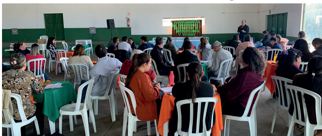
No final da Conferência foi montado o Conselho Municipal de Segurança Alimentar e Nutricional