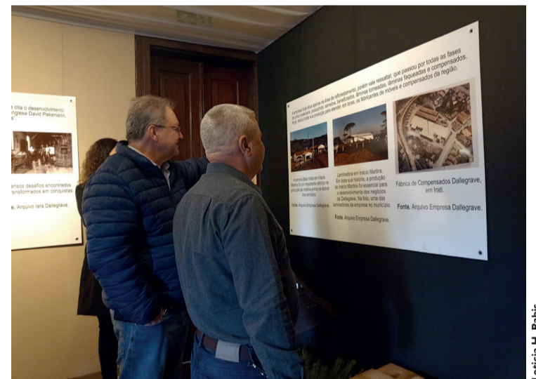
Exposição ficará a mostra até o dia 31 de julho a Casa da Cultura