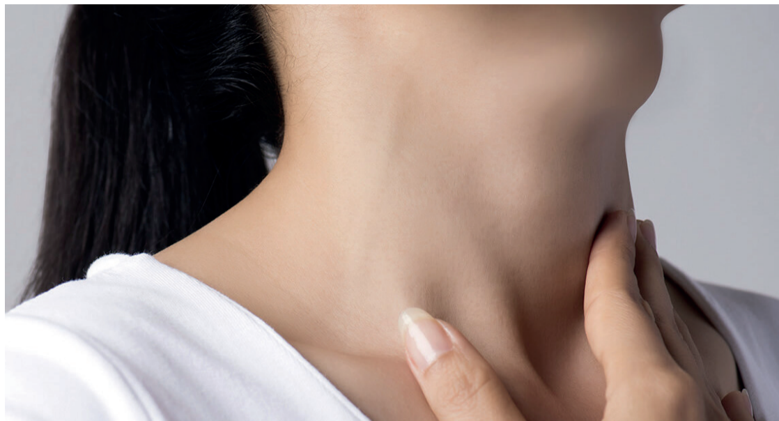
A intervenção em si não costuma provocar sequelas quando realizada de forma regrada

Consiste em um problema congênito que não pode ser