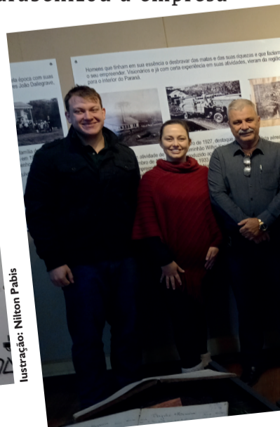
Ilustração: Nilton Pabis