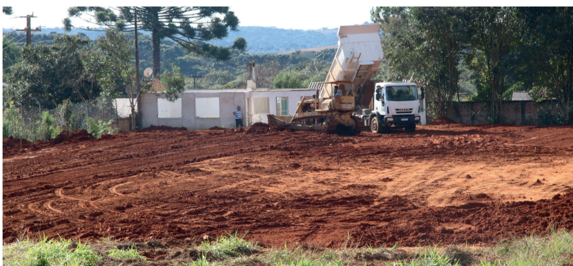
Com um terreno de 2.000m², a construção da Unidade Básica de Saúde terá cerca de 600m²

"Somos gratos por trazer mais desse serviço para a população de Fernandes Pinhei-