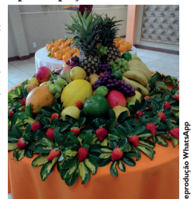
Houve também a exposição de alimentos