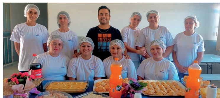
As 47 participantes receberam o certificado de conclusão

mulheres e que a capacitação nessa área pode ser um passo importante para a construção da carreira profissional e para a conquista da independência financeira. “A maquiagem é uma ferramenta importante para realçar a beleza natural e pode ser utilizada como instrumento de trabalho, aumentando as chances de inserção no mercado de beleza”, conclui Mayara.