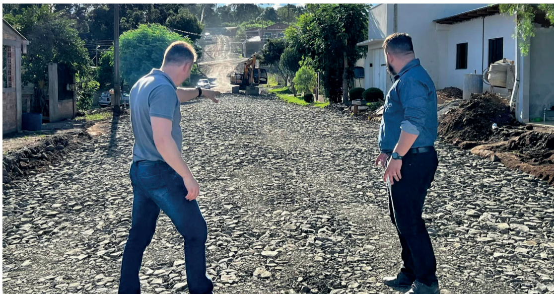
Obra de asfaltamento do Bairro Jardim Carvalho recebe investimento de R$ 2,5 milhões

Outro grande bairro a ser atendido, com cerca de 1.300 moradias, é a Vila Brasil que receberá mais de