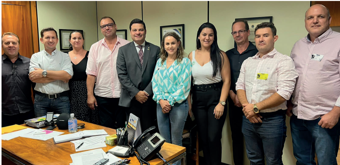
Em 2023 o tema abordado foi "Pacto federativo: um olhar para o futuro", e contou com 11 mil participantes

Os representantes da cidade também conversaram com senadores e deputados em busca de recursos para o município