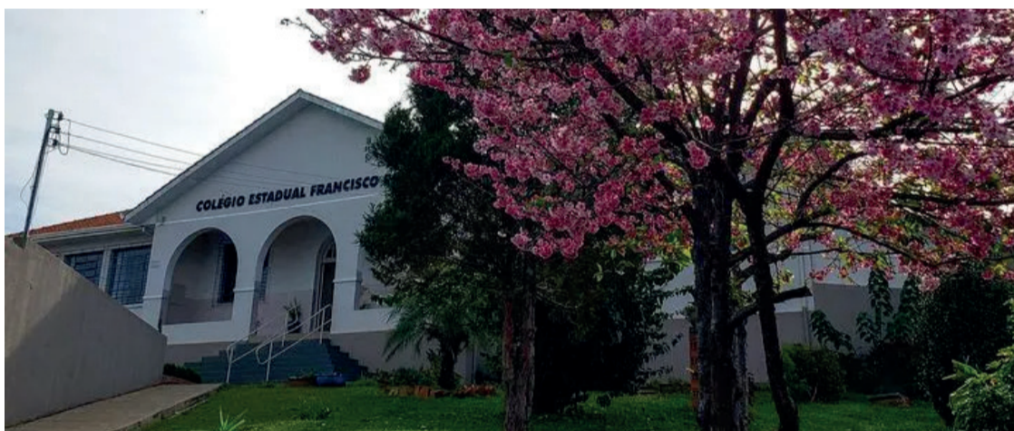
O adolescente disse que criou o perfil porque não gosta da escola, e que nunca gostou de estudar