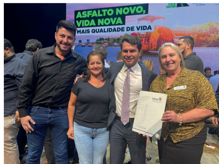
A prefeita participou do lançamento do programa em Curitiba

Cada município poderá receber um aporte de até R$ 5 milhões para viabilizar as obras. As licitações para contratação das empresas que executarão os trabalhos serão de responsabilidade das próprias prefeituras, que contarão com o acompanhamento técnico dos profissionais do Paranacidade, órgão vinculado à Secid, em todas as etapas.