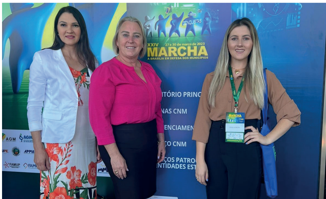
O evento contou com arenas técnicas, que discutiram assuntos sobre diversas áreas da gestão municipal