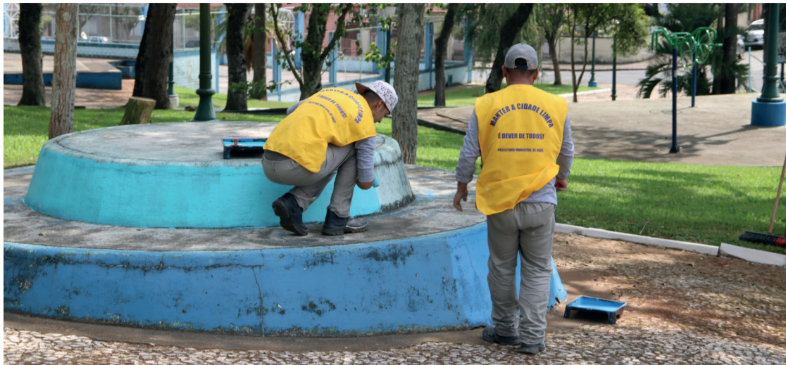
Presos trabalham 8 horas por dia e recebem 75% do salário mínimo para o desempenho das funções

Inicialmente, Irati têm, em fase experimental, as atividades desempenhadas por