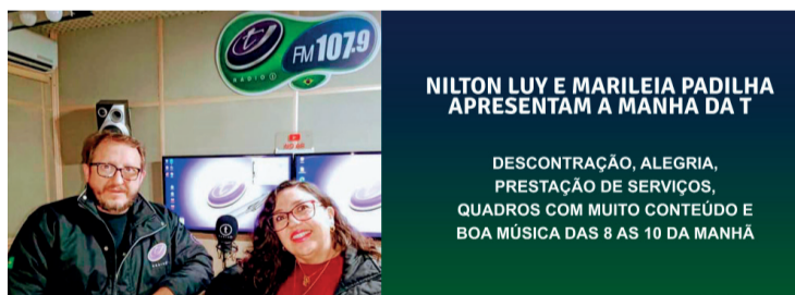
DE SEGUNDA A SÁBADO PELA RADIO T EM 107,9

Por último, importa recordar que a reinserção dos reclusos na sociedade é um processo contínuo que envolve a colaboração de vários intervenientes, nomeadamente autoridades prisionais, entidades patronais, sociedade civil e a própria comunidade. Todos têm um papel importante a desempenhar para ajudar os ex-reclusos a se reintegrarem com sucesso na sociedade e evitar a reincidência criminal.