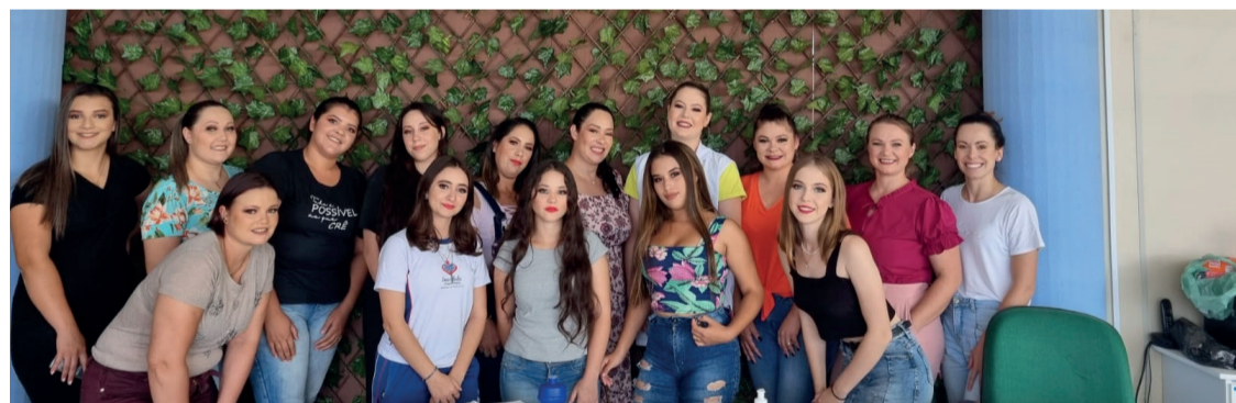
Os cursos profissionalizantes proporcionam mais oportunidades no mercado de trabalho

Os cursos foram disponibilizados de forma gratuita através de uma parceria entre a Secretaria de Assistência Social e o Senac