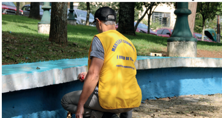
A cada três dias trabalhados equivalem há um dia de remissão de pena

Atualmente, a Secretaria de Habitação já utiliza a mão de obra de pessoas que cometeram algum tipo de delito, considerado brando, e por ordem judicial devem prestar serviços comunitários. Além da habitação, os serviços são prestados em espaços públicos, como, escolas, Centros Municipais de Educação Infantil (CMEIs), Unidades Básicas de Saúde (UBS), cemitérios e outros. Cada setor que recebe os prestadores de serviço dispõe de um supervisor que acompanha, fazendo a fiscalização quanto ao cumprimento do trabalho e número de horas.