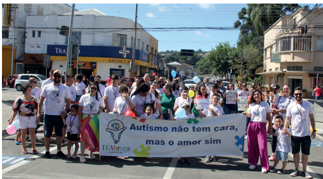
A Associação TEAbraça de Irati promoveu algumas atividades para famílias atípicas

No sábado (01), foi feita uma caminhada pelo Centro de Irati, às 10h e, logo após, uma blitz sobre a conscientização do autismo. Já no domingo (02), o encontro aconteceu no Parque Aquático onde teve cama elástica para as crianças, piquenique,