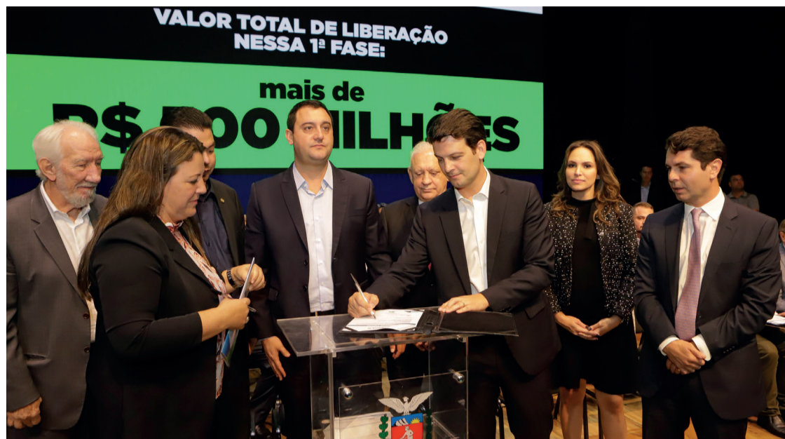
Fernandes Pinheiro vai receber R$ 5 milhões do programa para pavimentação e iluminação urbana