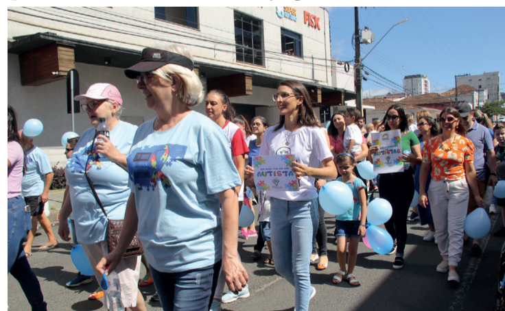
Dia 02 de Abril é considerado o Dia Mundial do Autismo