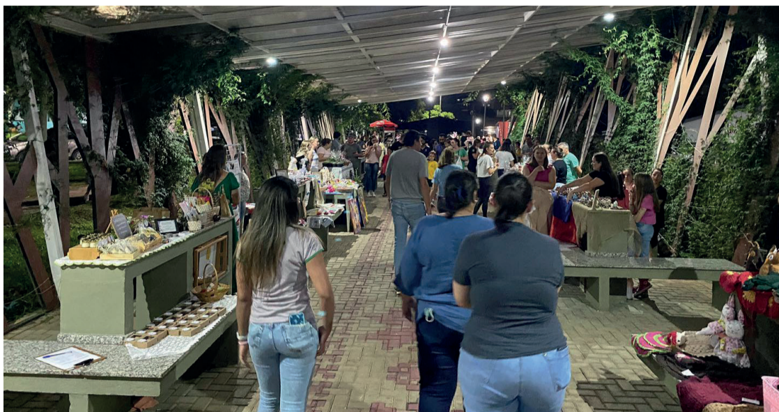
Objetivo é incentivar artesãos, pequenos produtores e o comércio local, sem nenhum custo

da de artesanatos típicos, pães especiais, além de diversão para as crianças, como pintura facial e cama elástica. A programação teve início às 18h, com encerramento às 22h, realizada na Rua Coberta, ao lado da biblioteca Municipal.