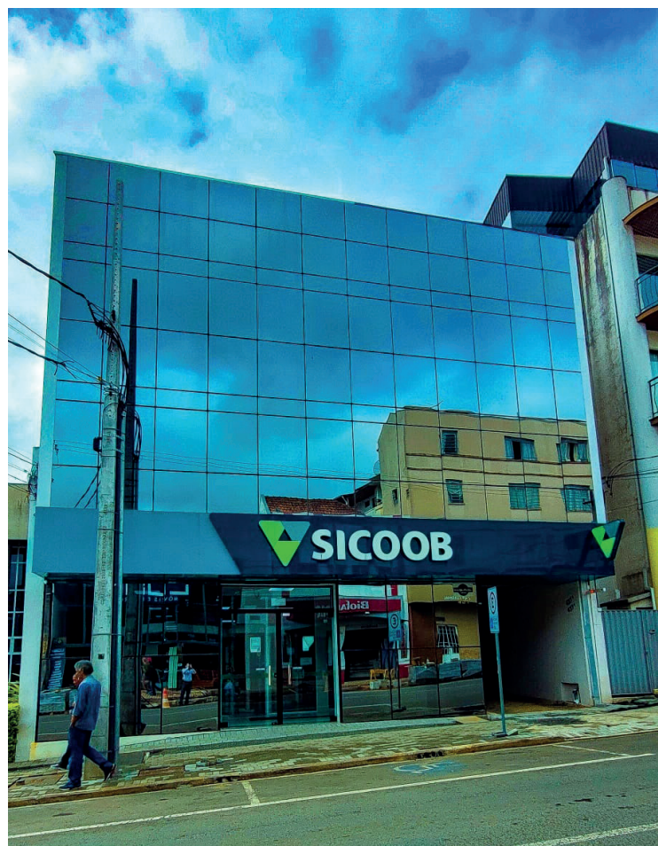
Atualmente, a cooperativa conta com mais de 50 mil cooperados

acontece no dia 24 de abril, a partir das 19h, no Espaço Santo Fole.