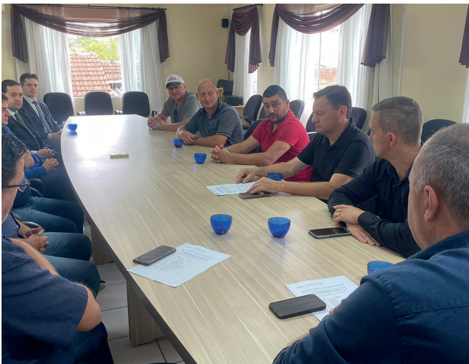
Encontro contou com a presença de autoridades para assinatura formal do documento

Investimento será de mais de R$ 2,6 milhões para melhor atender a população