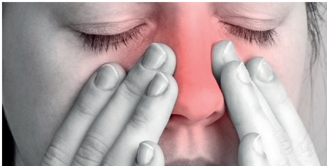
O tratamento pode ser feito com corticoides aplicados diretamente no nariz ou com irrigação nasal

A polipose nasal é uma doença inflamatória benigna, usualmente bilateral (acometendo ambas as cavidades