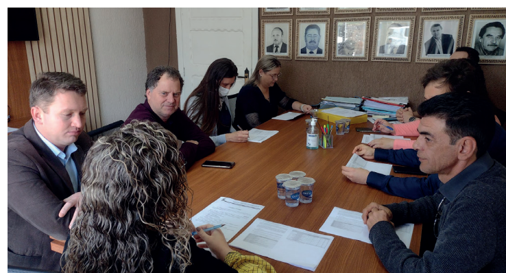
Equipe responsável por analisar as documentações referentes a licitação

A empresa MEP que realizou o projeto de arquitetura do Hospital trata desde o estudo preliminar, projeto básico, projeto legal e projeto executivo dos estabelecimentos de saúde. Projetos elaborados de acordo com a legislação sanitária e demais normas vigentes, com aprovação nos órgãos competentes, coordenação e compatibilização dos projetos complementares, buscando entregar o melhor resultado.