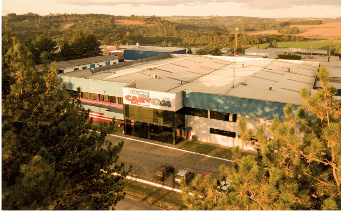
A empresa conta com mais de 750 colaboradores e produz mais de 30 mil pares de calçados por dia

No dia 21 de abril deste ano, a Folha de Irati comemora o 50º aniversário, e pensando neste momento especial, o jornal, em parceria com o Espaço Santo Fole está trazendo pela primeira vez na região a palestra de Leandro Karnal, considerado um dos maiores pensadores da atualidade. O evento