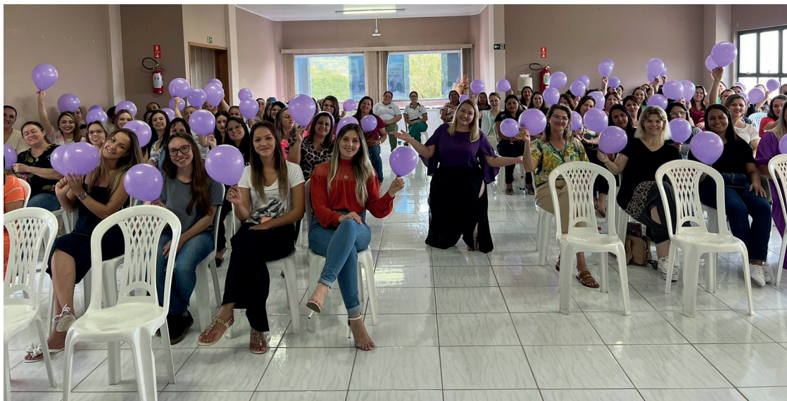
O evento foi uma forma de demonstrar a valorização das mulheres que prestam serviços para a população

“Fiz vários questionamentos para elas, para autoconhecimento, para olharem para a vida com mais amor,