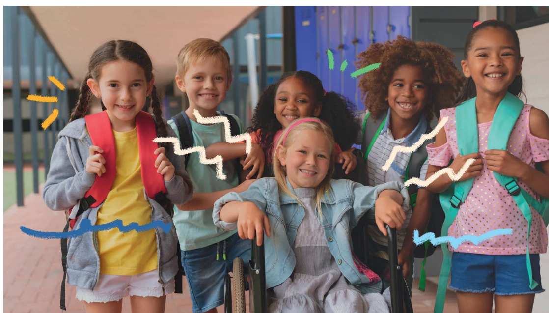
A inclusão é descrita como lei na Constituição de 1988 e como direito na Declaração de Direitos Humanos

A escola deve ser um espaço para todos, sem nenhuma forma de exclusão. Para que isto aconteça de uma forma simples, com amor, carinho e compreensão, vamos mostrar algumas dicas que podem