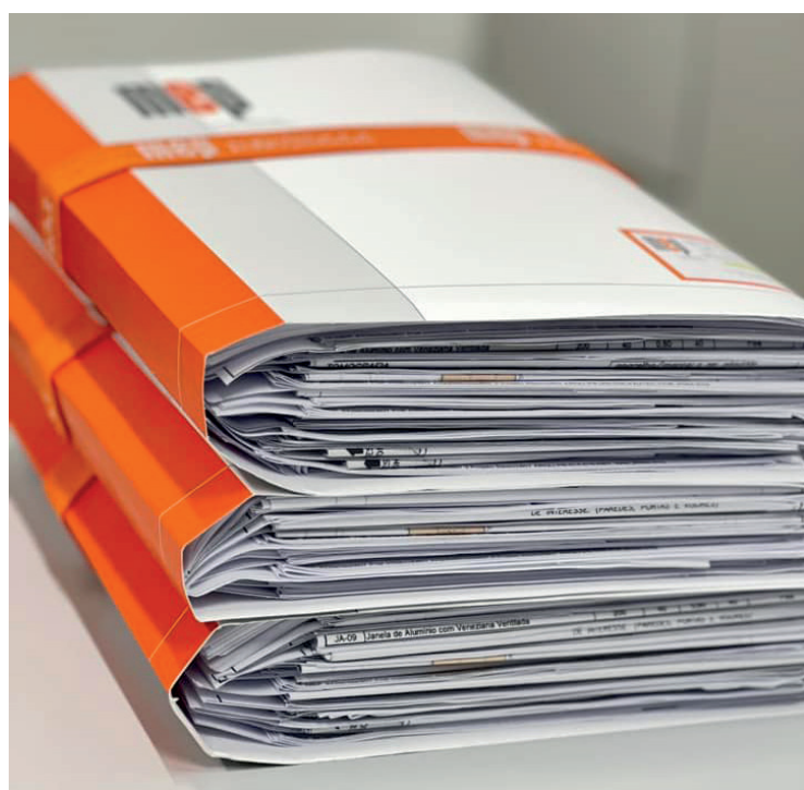
Projeto custou R$582.500,00 e levou cerca de 120 dias para ser concluído

licitação para a construção do projeto foi a MEP Arquitetura e Planejamento, com o valor de R$ 582.500,00. Ainda, a previsão para o início das obras é em maio deste ano, prazo este estipulado em no-