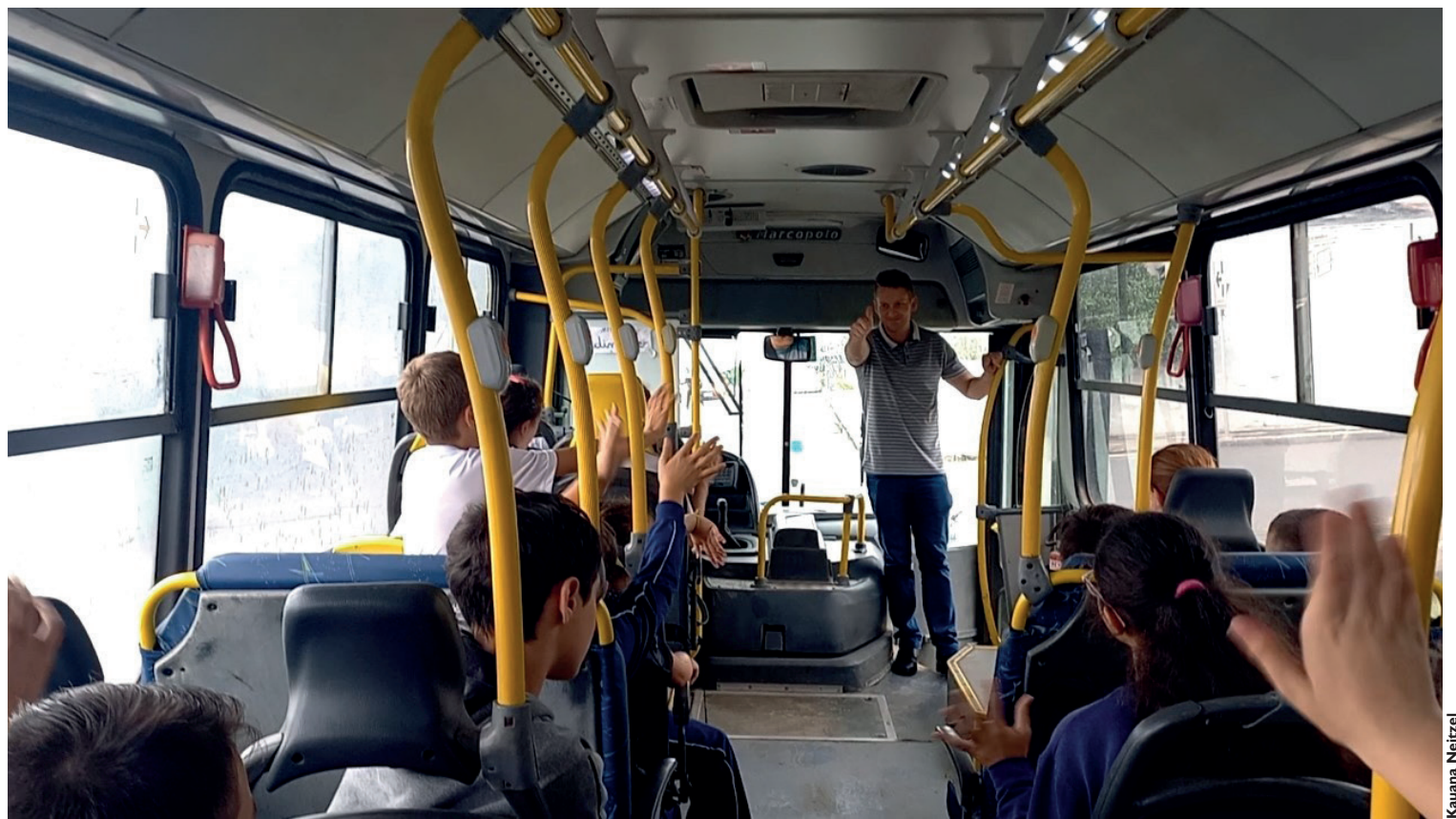
Caminho para buscar aumento no repassa é a conversa entre prefeitos juntamente com o Governo do Estado do Paraná

Recebeu: R$ 772.245,50 Gastou aproximadamente: R$ 8.000.000,00