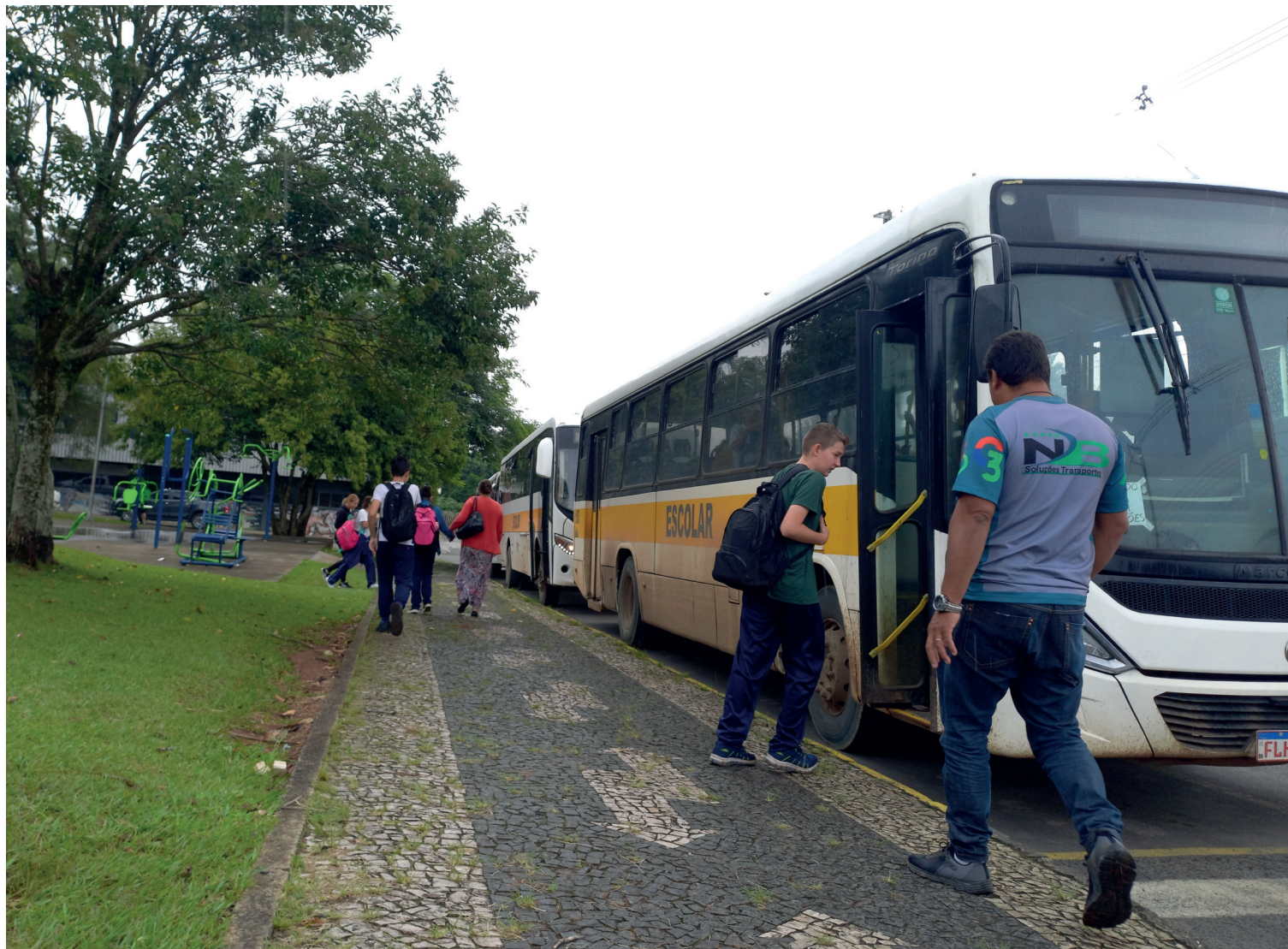
Têm direito ao transporte escolar público os alunos da Educação Básica, da zona rural e urbana da educação municipal e estadual

O serviço do transporte escolar é realizado pelos municípios, com recursos provenientes da União, por meio do Programa Nacional de Apoio ao Transporte Escolar (PNATE) do Estado, Programa Estadual do Transporte Escolar (PETE) e recursos dos próprios dos municípios. Os recursos federal e estadual são transferidos diretamente aos municípios, em nove e 10 parcelas respectivamente, dispensando a realização de convênios ou termos de adesão. A adoção do custo aluno/quilômetro é obtido a partir de informações cadastradas pelos municípios no Sistema de Gestão do Transporte Escolar (SIGET), segundo cálculo definido na Metodologia de Apropriação de Custos do Transporte Escolar do