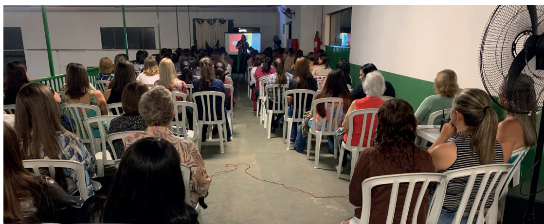
O evento contou com palestra e depoimentos de mulheres que se destacam em suas áreas de atuação

A programação contou com uma palestra com o tema “Empreendedorismo e empoderamento feminino” ministrada pela consultora nas áreas de inovação, empreendedorismo, planejamento estratégico e marketing, Ca-