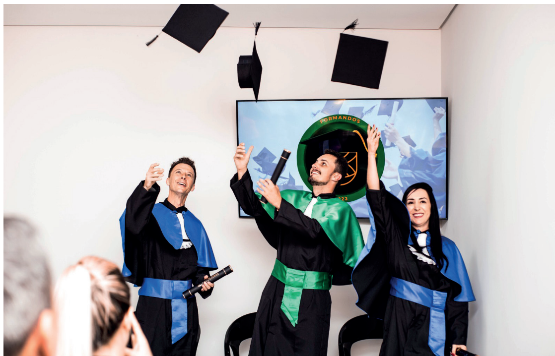
A primeira Formatura de Colação de Grau aconteceu no dia 09 de março de 2023, em Irati

A UNIFAEEL IRATI é relativamente nova por aqui, mas a base educacional já possui mais de 20 anos de mercado Educacional. A história de parceria da UNIFAEEL