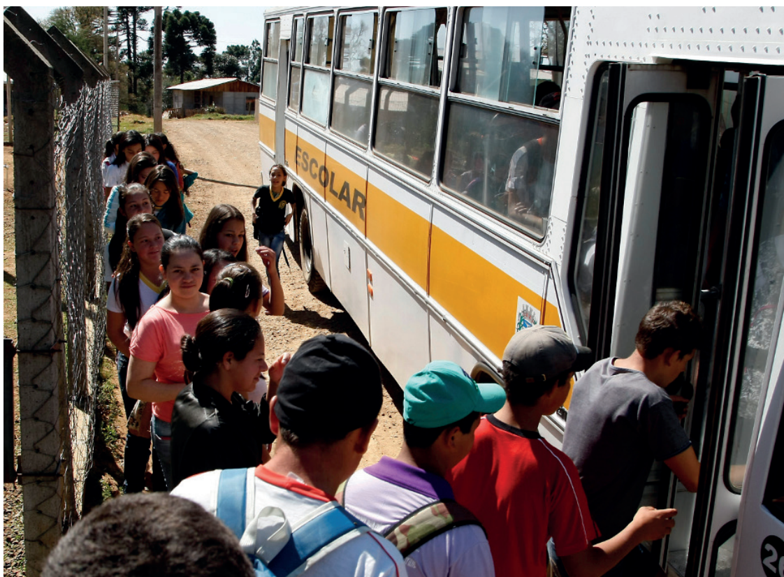
Municípios arcam com mais de 70% do valor total da frota do transportes escolar