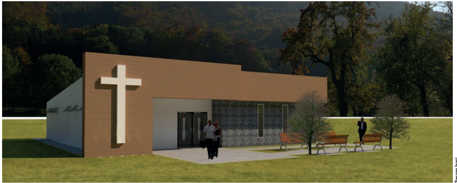
Local terá área coberta, hall de entrada, duas salas de vigília, duas copas e sanitários, tudo contando com acessibilidade

De acordo com o prefeito Jorge Derbli, as obras