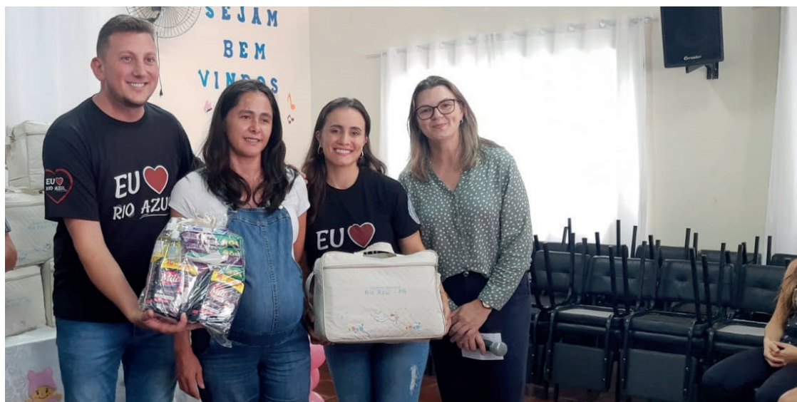
São 14 itens inclusos no kit com produtos necessários para a saída maternidade

Segundo a secretária da pasta e primeira-dama, Ghessi Bucco, no ano passado