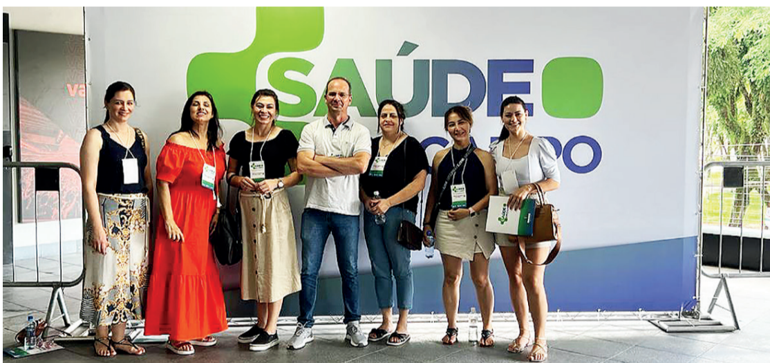
O projeto PlanificaSUS foi implantando primeiramente em Teixeira Sores e na 4ª Regional

O evento também engloba o 1º Encontro Anual do PlanificaSUS Paraná, o 2º Seminário Estadual de