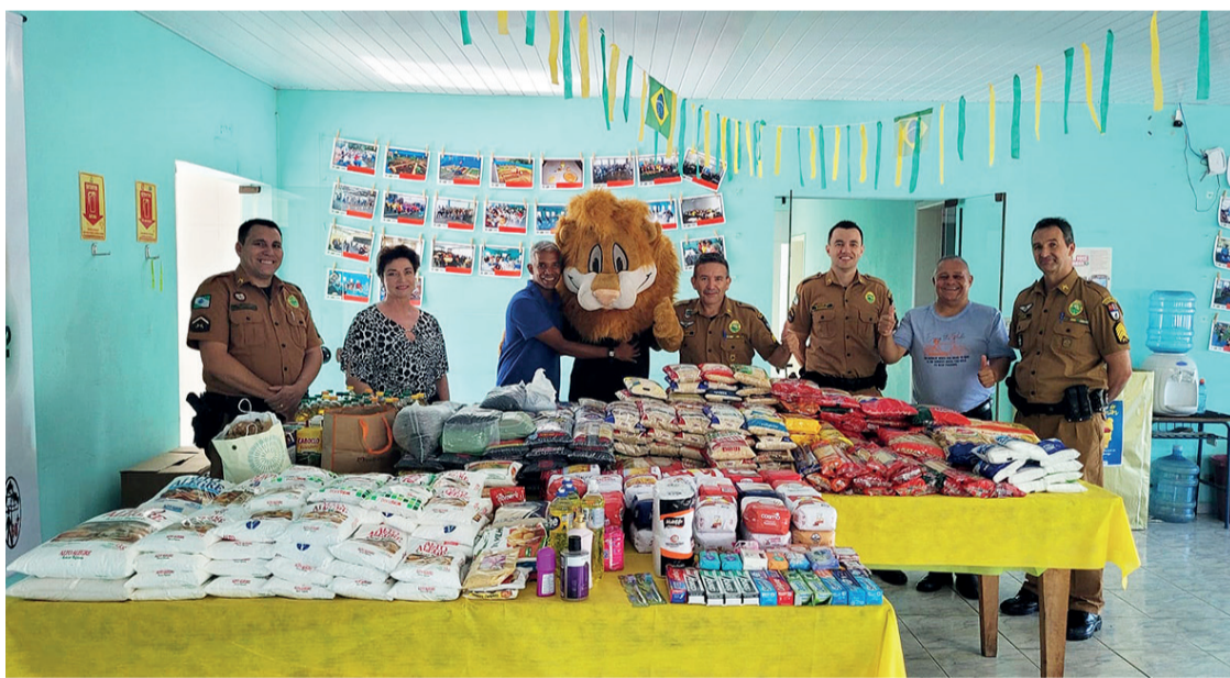
O programa Proerd busca incentivar o respeito, a empatia e ensina a ajudar o próximo