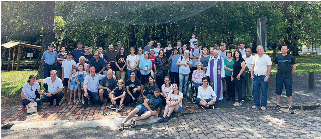
É realizada todos os anos a Caminhada Franciscana pela vida, paz e ecologia em Irati

Tradicionalmente é realizada todos os anos a Caminhada Franciscana pela vida, paz e ecologia em Irati. Está é 14ª edição do evento, e este ano reuniu cerca de 120 pessoas. A Ordem Franciscana Secular (OFS), o Serviço de Justiça Paz e Integridade da Criação (JPIC) e outros membros da comunidade percorrem o trajeto de 7km, saindo as 6h da Capela São Francisco de Assis com destino a Unicentro. Pessoas de Irati,