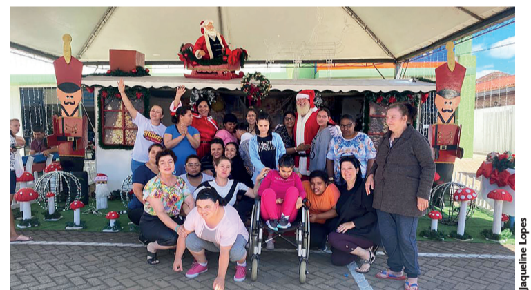
Pessoas das casas de acolhimento do município prestigiaram