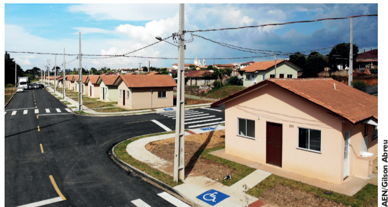
Conjunto Habitacional também recebeu toda infraestrutura