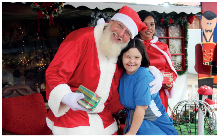
Alunos da APAE de Irati, participaram do evento de Natal