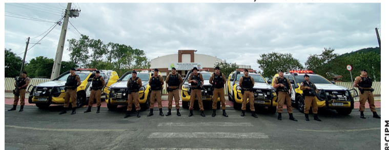
O principal objetivo é ampliar o policiamento nas áreas rurais

Ainda, Nabozny relata que é uma operação que não visa apenas a presença policial nas comunidades interioranas, mas que também vai realizar bloqueios e buscas. “A presença policial por si só já aumenta a sensação de segurança na população, os policiais vão interagir com a população e isto, sem dúvidas, vai trazer uma proteção maior”, finaliza.