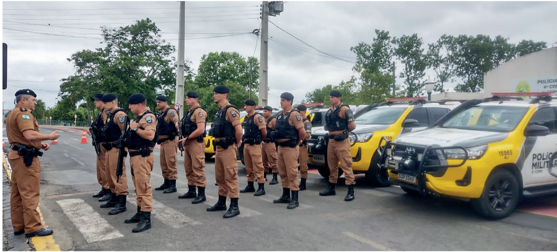
A Operação é uma iniciativa do 4º CRPM para ampliar o alcance da Patrulha Rural Comunitária

Durante o evento, foi destacado que os policiais pretendem atuar de maneira preventiva na