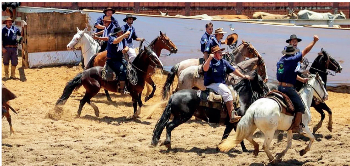
Ao todo, 18 competidores de Irati participaram das disputas em grupo que aconteceu em Ivaí

Neste período, também ocorreu o 13º Encontro de Seleções Esportivas, que é a competição onde os melhores laçadores de cada uma das 17 regiões participam para decidir quem vai representar o Paraná na etapa nacional. Os vencedores do 32º Encontro disputam nas categorias