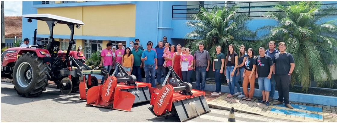
Sec. de Agricultura de Guamiranga