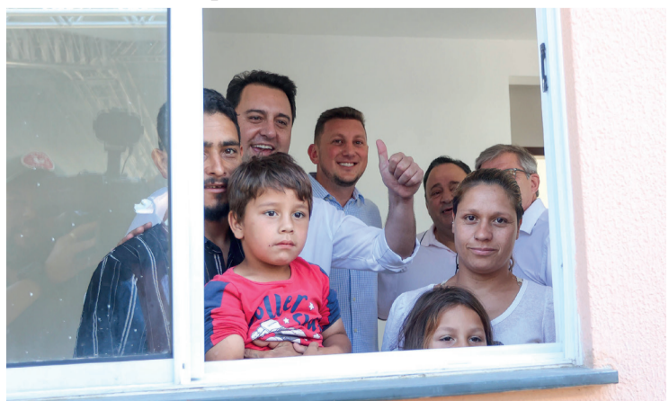
Ratinho Junior conversou com uma das famílias beneficiadas

em um bairro que não tem asfalto e transformar a vida dessas pessoas. Esse é um grande programa que estamos construindo com os prefeitos, e a ideia é avançar a partir de janeiro de 2023”, conclui o governador.