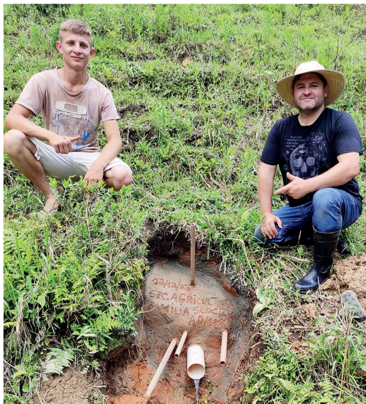
O objetivo do projeto é preservar e recuperar as nascentes

O objetivo do projeto é preservar e recuperar