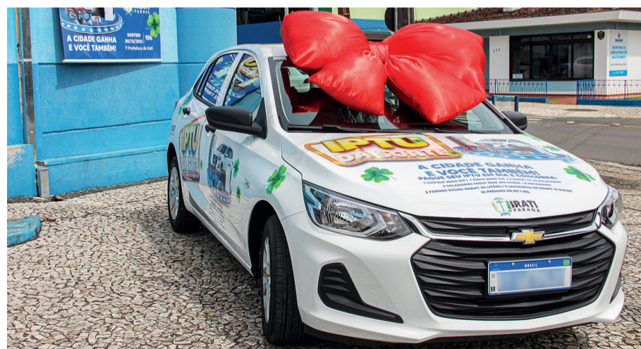
Automóvel sorteado é automático e vale aproximadamente R$ 70 mil

Para participar da promoção, o contribuinte tem que estar com o IPTU em dia, ir até a Prefeitura, retirar o cupom e colocar na urna, assim está apto para concorrer aos prêmios.