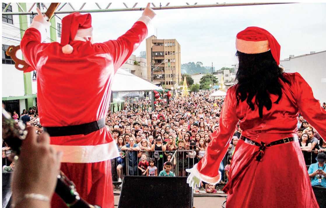
As atrações da Rua Encantada estarão abertas para os visitantes até o dia 23 de dezembro

Segundo o prefeito de Irati, Jorge Derbli, a escolha da Rua foi feita devido ao espaço e a grande acomodação do público que a rua proporciona, e pelo fato de que ela está localizada no centro da cidade, o que deve atrair mais visitantes durante este período e fomentar ainda mais o comércio. Toda a ornamentação do local foi feita através da Secretaria de Cultura, em parceria com as