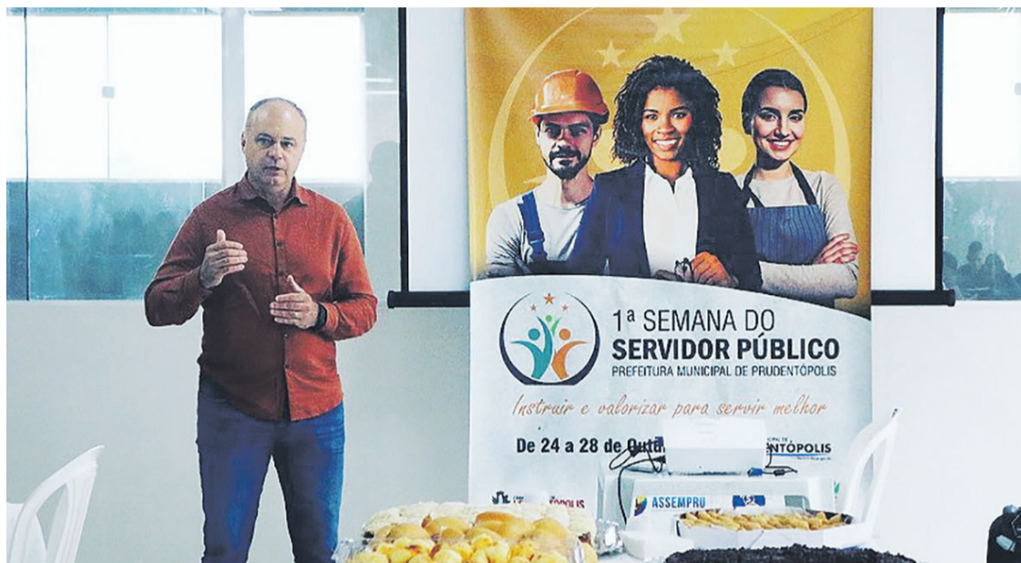
O evento aconteceu com o objetivo de valorizar e reconhecer os servidores públicos da cidade

O prefeito da cidade, Osnei Stadler, esteve acompanhando as atrações, e comenta acerca da importância para os servidores. “Essa semana do servidor público é um modelo idealizado pela nossa gestão, sendo algo inédito para os nossos servidores. Sabemos a importância de cada um deles, são eles os responsáveis por fazer o município se desenvolver cada dia mais. E nosso propósito é demonstrar o mínimo de retribuição a eles, oferecendo