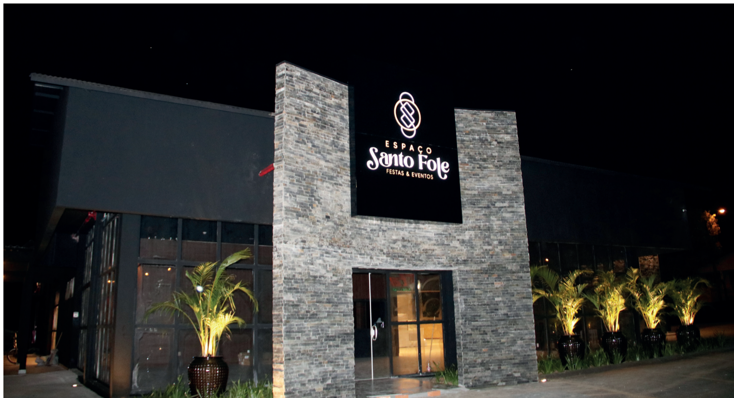
A inauguração acontece na próxima sexta-feira, 04 de novembro, mas a agenda de eventos do local já está sendo preenchida