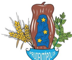
Prefeitura Municipal de Prudentópolis