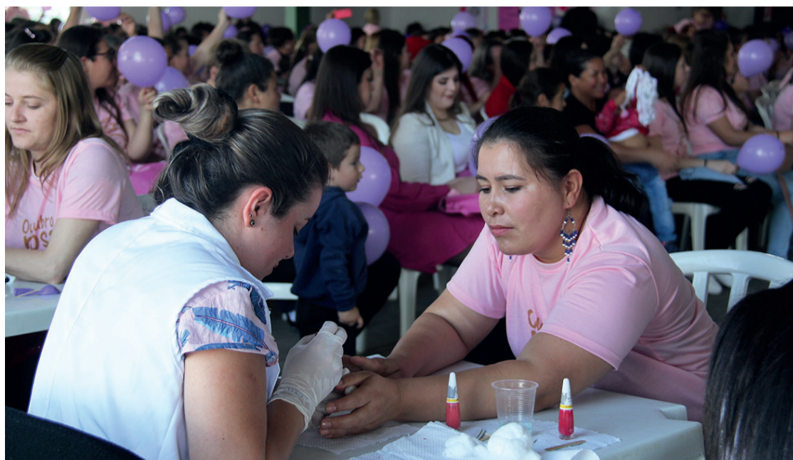
O evento aconteceu na sexta-feira (21), no Centro de Eventos Miguel Belinoski, no período da tarde

O evento aconteceu no Centro de Eventos Miguel Belinoski, durante o período da tarde. "Contamos com quase 400 mulheres que participaram do evento, que engrandece ainda mais o Outubro Rosa no nosso município. A grande importância é a prevenção, trazemos toda essa mulherada para a conscientização do Outubro Rosa, fazer a consulta de rotina, fazer o auto-exame, manter o auto-