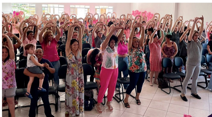
As participantes também realizaram exercícios físicos

Ela diz, ainda, que para se manter saudável e prevenir diversas doenças é necessário manter uma alimentação equilibrada, fazer exercícios físicos com frequência, realizar o autoexame das mamas mensalmente e ficar atenta a qualquer sinal diferente que o corpo apresentar. “O simples ato da observação ao funcionamento do seu corpo pode salvar sua vida”, conclui.