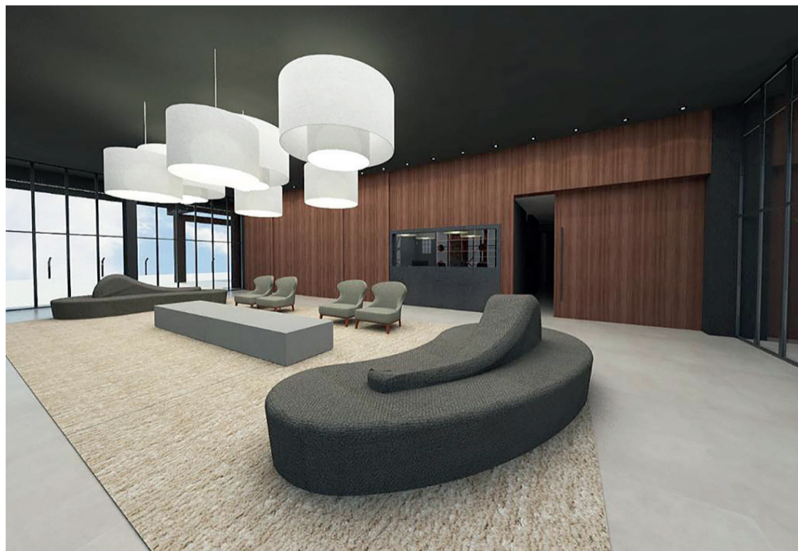
O espaço comporta até 1.300 pessoas sentadas confortavelmente em formato de auditório

O Espaço Santo Fole fica localizado na Alameda Virgílio Moreira, número 45, em Irati. O show do cantor Alexandre Pires acontece no dia 04 de novembro e está com apenas os últimos ingressos disponíveis. Mais informações pelo número (42) 9 9822-2221.