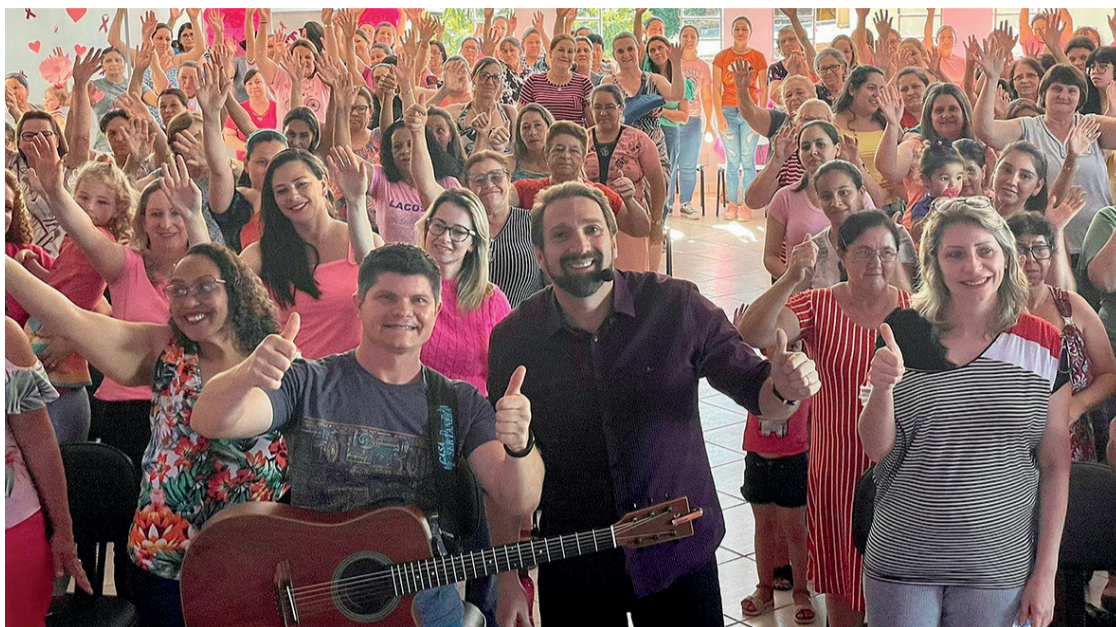
Mais de 200 mulheres participaram do evento de encerramento da campanha do Outubro Rosa

N a última quarta-feira (26) a Secretaria de Saúde de Guamiranga realizou o encerramento da campanha referente ao Outubro Rosa. Na oca-