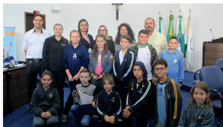
Os alunos dos municípios que participaram do Concurso Soletrando

A Folha de Irati apresentou os três primeiros colocados com um vale presente na Loja Sr. Smart de Irati. O 1º lugar recebeu um vale de R$ 150,00 o 2º lugar R$ 100,00 e o 3º lugar R$ 50,00.