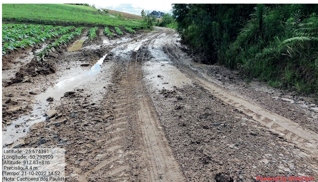
As chuvas causaram danos em pontes, destruíram bueiros e estradas, estragaram plantações

O banco de dados do Sistema de Tecnologia e Monitoramento Ambiental do Paraná – SIMEPAR divulgou que, de acordo com dados da estação meteorológica de Inácio Martins, a mais próxima de Rio Azul, no mês de setembro foi registrado 252,4mm de chuva e até o dia 25 de outubro, foi