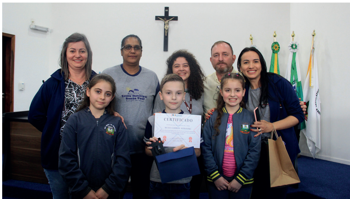
Na foto, os três alunos vencedores do 1º Concurso Soletrando a Cultura promovido pela Folha Escola

Na ocasião, algumas autoridades municipais estiveram presentes, assim como, representantes das escolas finalistas e dos parceiros do Concurso. Para a fase final,