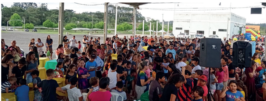
A festa aconteceu no Parque da Prainha e teve uma programação voltada para as crianças e suas famílias

A festa aconteceu no Parque da Prainha, e contou com exposições da Polícia Militar com o módulo móvel, viatura da ROTAM, manequim com fardamento da PM, objetos utilizados pelos policiais, além da viatura do corpo de bombeiros que também esteve presente com barco de resgate e equipamentos de mergulho.