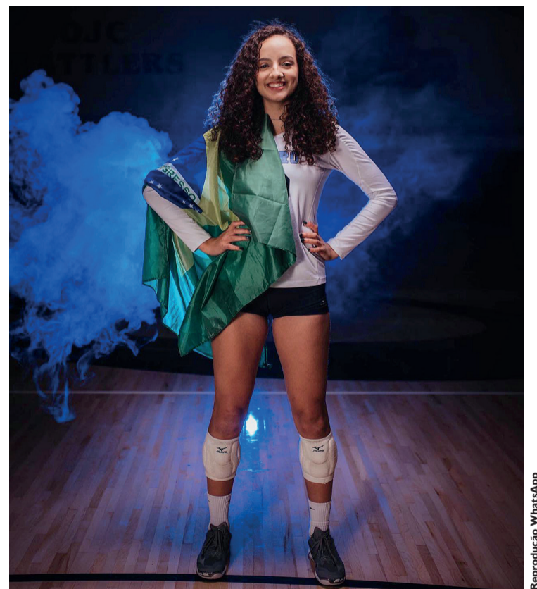
Para ganhar a bolsa, é necessário ter notas boas e saber falar inglês

distorções, que por oposição à santidade o apóstolo chama de impureza, podemos até chamar de desgraça. Sabemos como Jesus sacudiu os preconceitos existentes a respeito do puro e do impuro. A pureza não depende do exterior, ela brota do íntimo, nasce do coração. Se o coração é de Deus, se torna fonte de pureza. Ele gera amor, que purifica e santifica. Que todos vivam no amor de Deus. Paz e Bem!