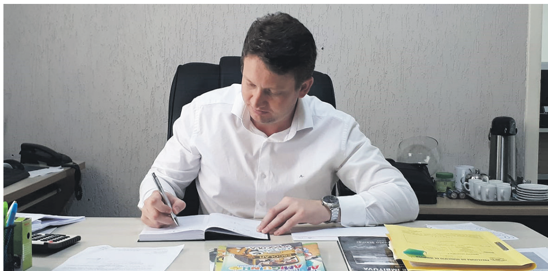
Além da internet, a Secretaria investiu em SmartTV's de 50 polegadas em casa sala de aula

O vice-prefeito e secretário de Educação e Cultura de Imbituva, Zaquieu Bobato, concluiu na quinta-feira (10) o plano de ação assumido com a comunidade escolar, que era a de dotar todas as escolas e CMEI's com internet e ambientes com cobertura wi-fi. A rede municipal de ensino de Imbituva tem