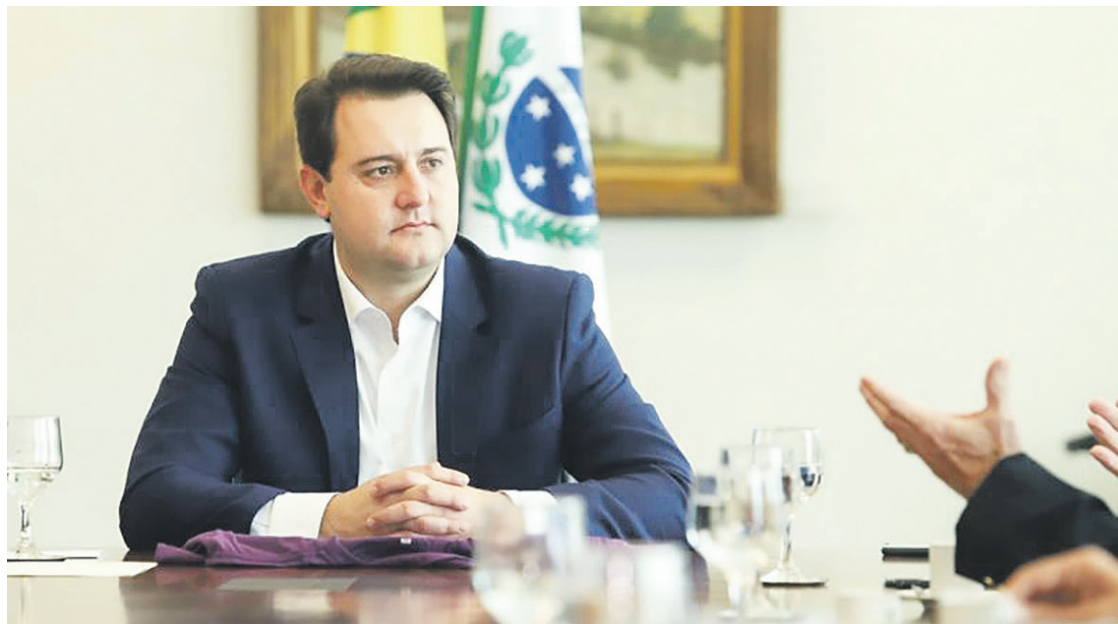
Segundo o texto, o uso em espaços ao ar livre será opcional a partir de quinta-feira (17)

Logo após a sanção, o Governo do Estado publicou um decreto (10.530/2022) com detalhes sobre os locais onde o uso pode ser flexibilizado e as situações em que ainda é necessário utilizar o equipamento de proteção. Segundo o