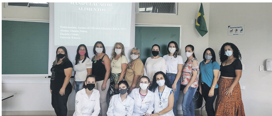
As merendeiras do município participaram de uma formação com docente e alunas do curso de Nutrição