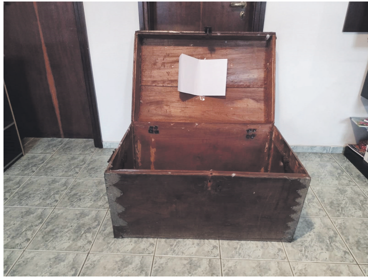
Baú abrigou todos os pertences da família quando imigraram ao Brasil

A partida no dia 12 de outubro de 1911 deverá