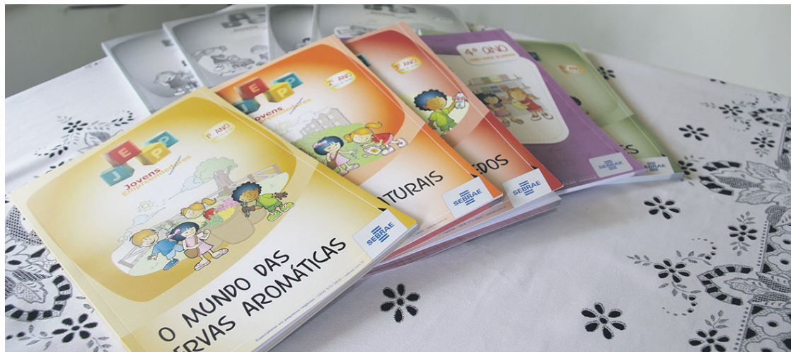
Os materiais que serão utilizados foram elaborados e disponibilizados pela equipe do SEBRAE

A nova matéria passará a integrar a grade de disciplinas semanais das aulas do Ensino Fundamental, do 2º ao 5º ano, sendo ministradas pelos próprios professores responsáveis pelas turmas. Para estarem aptos para o ofício, no mês de dezembro de 2021, o SEBRAE realizou a capacitação desses profissionais quanto aos conteúdos que devem ser trabalhados. Além disso, com o objetivo de guiar os docentes, eles receberam