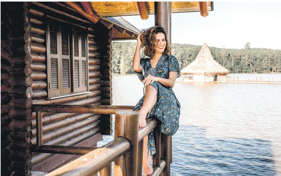
A Pousada Virá Charme Resort já é conhecida pela passagem de grandes atores e atrizes, que escolhem a tranquilidade e beleza do lugar para relaxar e curtir a natureza. Desta vez, quem marcou presença foi a atriz Paloma Bernardi, que tirou uns dias de folga e curtiu o lugar.