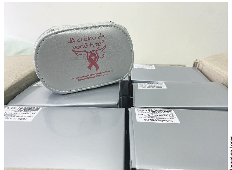
Secretaria entrega brinde as mulheres que fizeram os exames

Também, a Secretaria está em busca das mulheres que estão há três anos sem realizar o preventivo, que precisa ser anual para garantir a prevenção de doenças. Ainda, para aquelas que realizam os exames neste mês, recebem um brinde, um kit de unha. “Nós, mulheres, gostamos de ganhar presente, e aqui não é diferente. Além de cuidar da saúde, também entregamos um brinde, um kit de unha bem bacana, e elas estão satisfeitas”, finaliza a secretária.