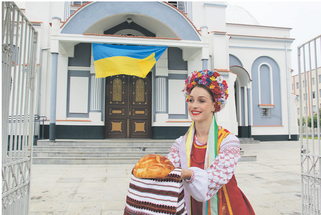
Famílias prudentopolitanas oferecem seus lares para receber imigrantes ucranianos

O município é conhecido como a “Ucrânia brasileira”, já que cerca de 80% da população de prudentópolis é descendente da nacionalidade. Além disso, tem como língua co-oficial a ucraniana e como cidade-irmã Ternopil, inclusive, autoridades do exterior já visitaram o município