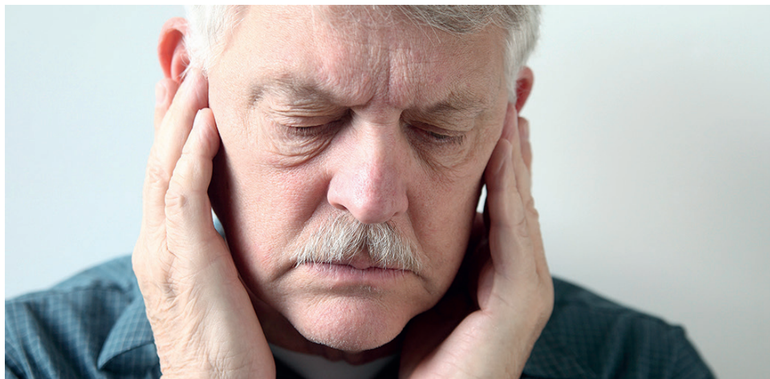
Os sintomas começam de repente e podem durar minutos, horas ou dias. A avaliação clínica é essencial

Mestrado clínica cirúrgica IPEM (H.U.E/UFPR)