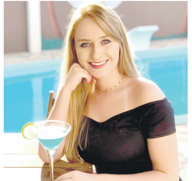
A fotógrafa Amanda Bozza comemora a chegada de mais um aniversário no sábado (19). Que esta data ainda se repita por muitos anos e que você aproveite ao máximo esta nova fase. Felicidades!!!