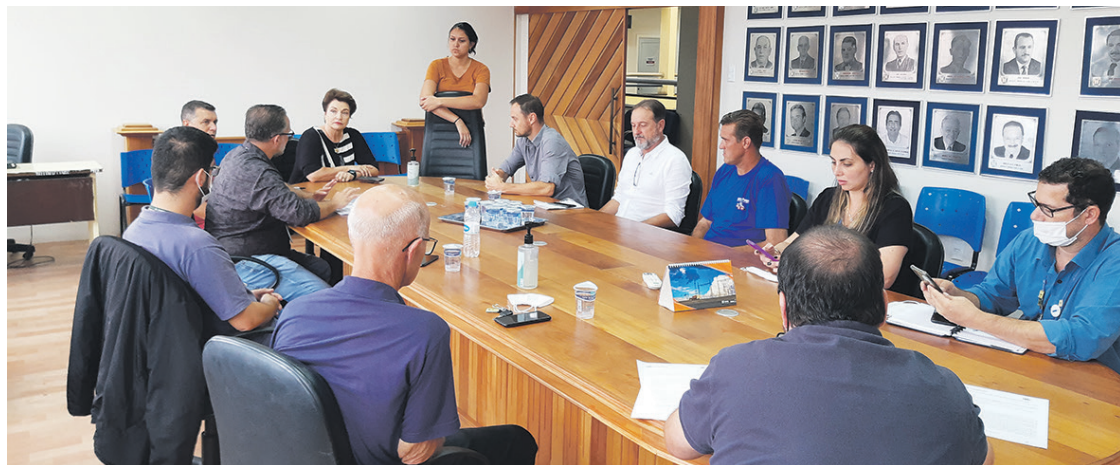
Reunião sobre o loteamento Professor Lico aconteceu no salão nobre da Prefeitura de Irati

Durante a reunião, foram feitas tratativas para definir os prazos de entrega de materiais de esgoto e saneamento, com o objetivo de dar início o mais rápido possível nas obras. Também foram discutidos planos de trabalho e o projeto das 174 casas a serem