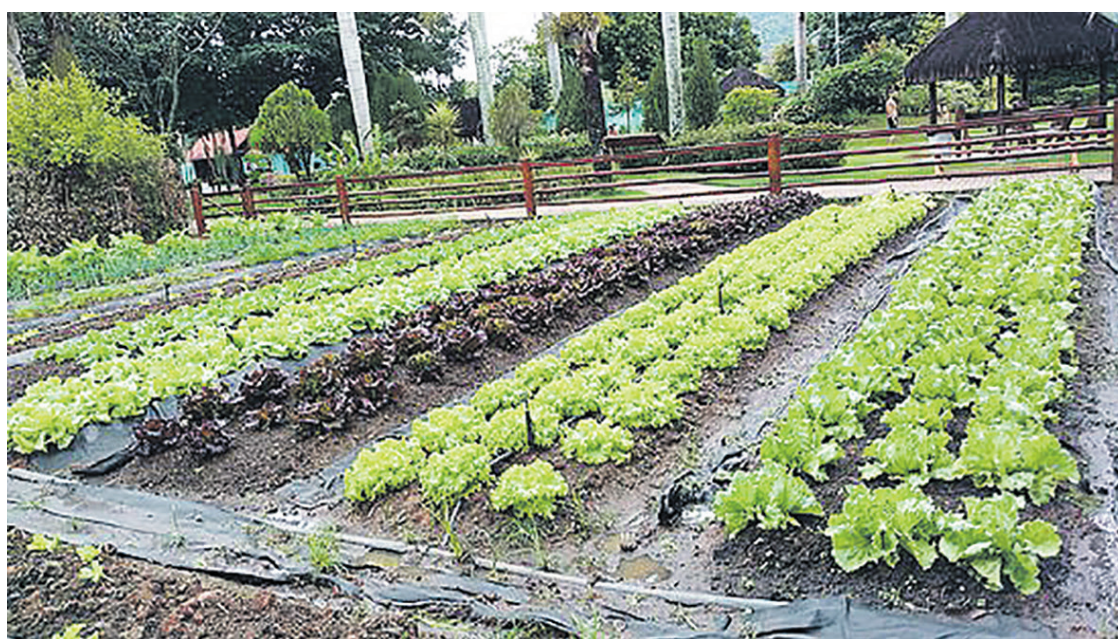
Segundo a RENAST, o Brasil é um dos maiores consumidores de agrotóxicos no mundo

São inúmeras as vantagens de ter uma horta em casa ou na escola, mas a principal delas é saber exatamente de onde vem o alimento que está sendo consumido e ter a certeza que são ricos em nutrientes, sem a presença de agrotóxicos, venenos e outras toxinas que fazem mal ao