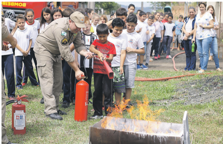
Ação do Folha na Escola com alunos de Rebouças em 2018

Além de diversos assunto que vamos trabalhar neste ano, edos concursos que iremos realizar, não podemos esquecer que estamos enfrentando uma pandemia e os cuidados não podem parar, é importante manter o distanciamento social, o uso do álcool gel e também da máscara.