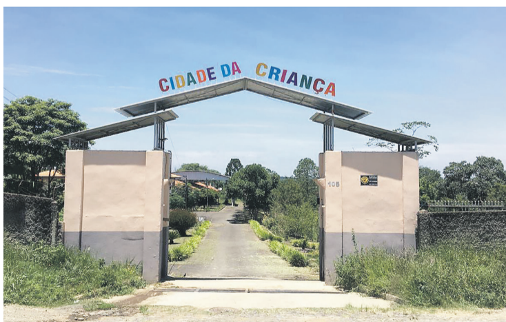
Os alunos frequentam o espaço em período de contraturno

O espaço conta com 75 alunos que participam de atividades recreativas em período de contraturno, ou seja, no momento em que não estão na escola. São ofertadas atividades com uma pedagoga, com auxílio nas atividades escolares, oficinas de yoga, oficina de reflexão e espiritualidade, artesanato, horticultura, jardinagem e os alunos também fazem refeições durante o dia com café