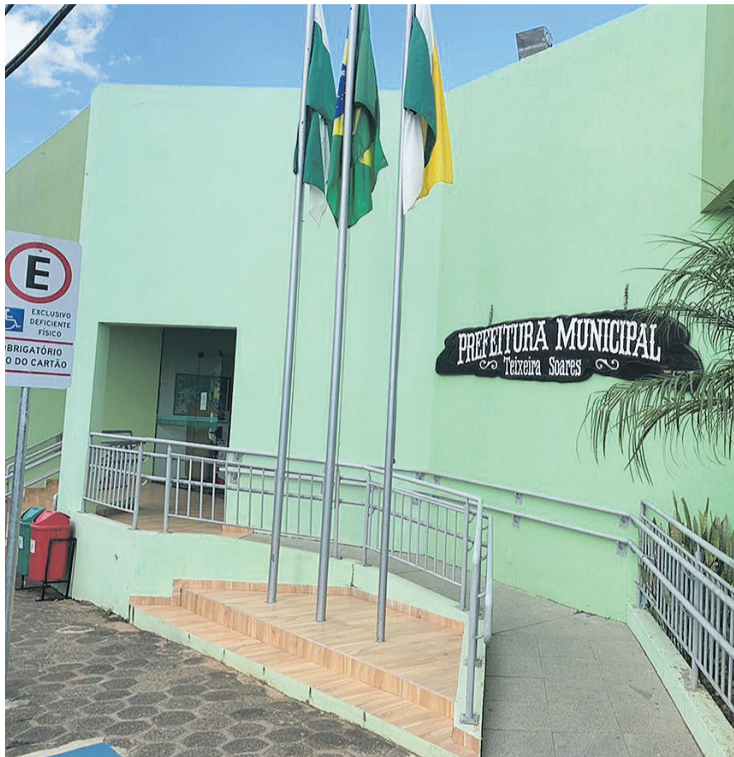
O prazo para adesão do REFIS se encerra no dia 31 de dezembro de 2022

“O objetivo da lei do REFIS, que todo início do ano é aprovado pela Câmara de