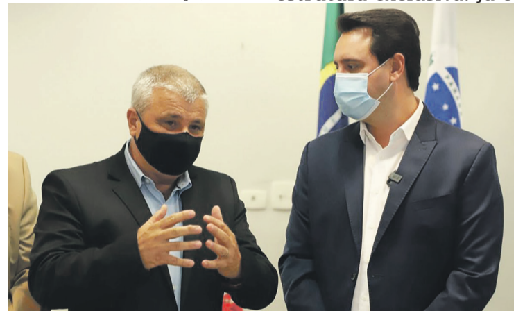
Prefeito Jorge Derbli e governador Ratinho Junior em reunião

sica, além de integração social e cultural. Os usuários poderão passar o dia no local de forma gratuita, retornando para suas casas no fim da tarde. A capacidade é para até 500 pessoas.