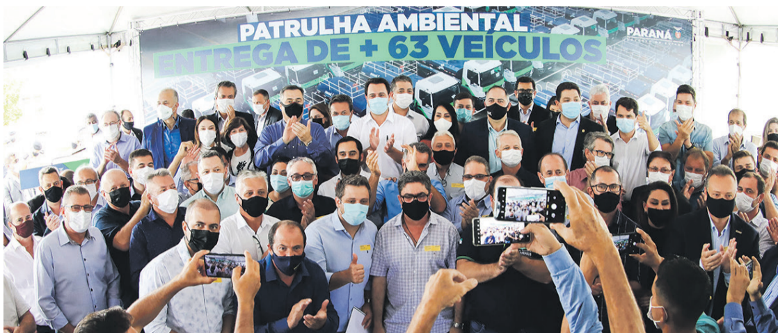
Governo do Estado faz a entrega dos 63 caminhões da Patrulha Ambiental, em Curitiba

Foram entregues seis caminhões-pipa, seis caminhões-baú, cinco caminhões caçamba e poliguindaste, 18 limpa-fossas e 28 caminhões compactador. Desde o início da atual gestão, o Estado já investiu R$ 78,3 milhões para a aquisição de 305 caminhões, todos destinados aos municípios. As entregas fazem parte da Patrulha Ambiental, iniciativa da Secretaria de Estado do Desenvolvimento Sustentável e do Turismo