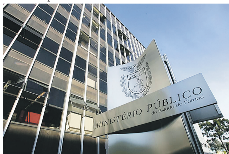
MPPR do Paraná ofereceu denúncia contra o acusado

A orientação do Ministério Público para os pais, professores, todos os profissionais que convivem e