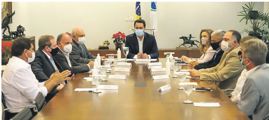
Governador Carlos Massa Ratinho Junior assina ordem de serviço para construção da primeira Cidade do Idoso

O projeto é pioneiro no Estado e reunirá em um mesmo ambiente uma série de serviços, como atividades físicas, atenção à saúde específica para esta faixa etária, cozinha comunitária, letramento, aulas de informática, dança, mú-