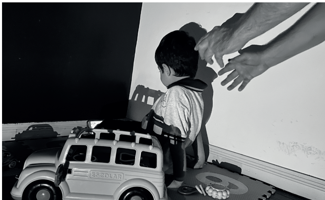
Acusado foi preso em Irati na terça (08), e responderá criminalmente por estupro de vulnerável

O pedido de prisão preventiva foi deferido pela Justiça, e o acusado foi preso em Irati pela Polícia Civil de Curitiba, onde está encarcerado, devido ao crime ter acontecido na capital. Agora, o autor responderá um processo criminal por