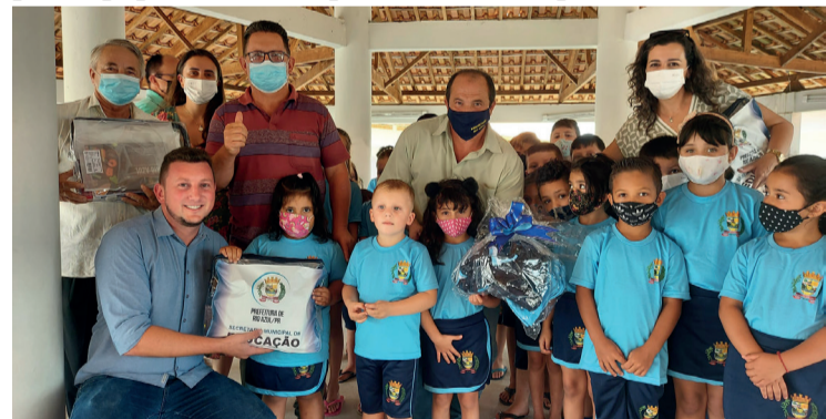
Entrega aconteceu em todas as escolas do município, da área urbana e rural