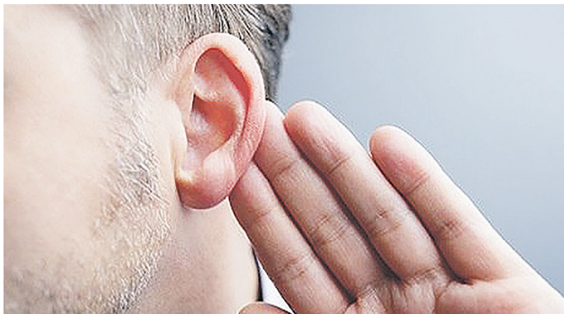
O problema pode ser imediato ou demorar anos para ser notado, e acontece em qualquer idade

Quando somos expostos por um longo tempo a esses barulhos intensos, estamos correndo o risco de sofrer danos ao sistema auditivo. Esses danos surgem de forma gradativa e tornam-se piores com os anos, se a proteção apropriada não for tomada.