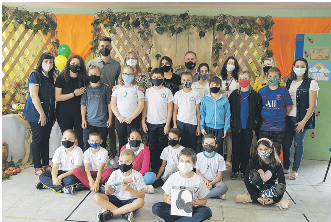
Fase municipal do Concurso Cultural de Redação desenvolvido pelo Projeto Folha na Escola, em 2021

É uma forma de viver o presente sem afetar as próximas gerações, cui-