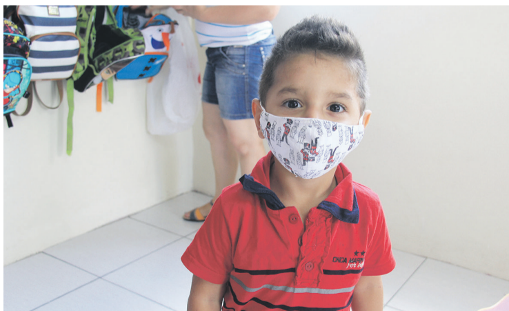
Aluno do maternal II do CMEI Santo Antonio, em Irati

Quando chegar em casa, retire a mesma e, caso ela seja descartável, jogue no lixo de material orgânico não reciclável. Tente não tocar em mais nada até higienizar corretamente as mãos.