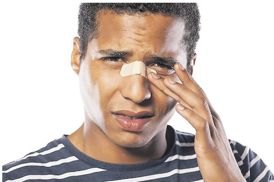
O sintoma mais evidente de uma fratura no nariz é a deformidade do nariz, já que o osso pode ser deslocado

Mestrado clínica cirúrgica IPEM (H.U.E/UFPR)