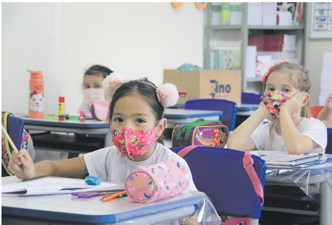
Aluna do 1º D ano da Escola Municipal Padre Wenceslau, no bairro Rio Bonito, em Irati

O coronavírus pode ser espalhado quando pessoas infectadas tosem ou espirram, fazendo com que gotinhas de saliva fiquem em lugares de uso comum, como a maçaneta da porta, canetas,