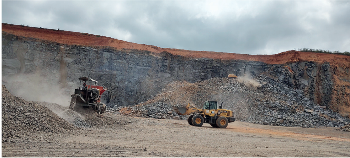
Já foram produzidas cerca de 1.800 cargas de pedras prontas para utilização nas estradas

A Vice-prefeita e, atualmente, Prefeita em exercício